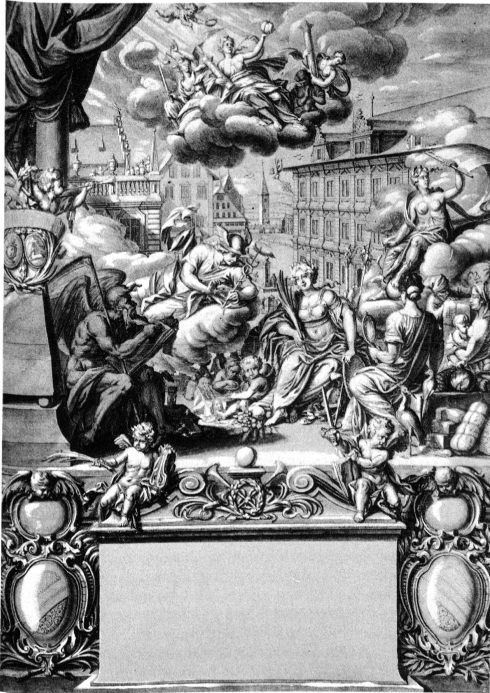
5 Zürich. Glorifizierung des Standes Zürich. Federzeichnung mit Sepia, weiss gehöht, von Johann Melchior Füssli (1677–1736), nach Allianz entstanden zwischen 1723 und 1733. (Zentralbibliothek Zürich.)

verschiedenen Stellen arbeiten, wertvolle Steinchen einsetzen, aber eigentlich immer wieder feststellen müssen, dass die «Untermalung», die Sinopie fehlt, welche zeigen könnte, ob der eingesetzte Stein am Ort sinnvoll oder aber zur Klärung des Ganzen einer an einer anderen Stelle doch besser gewesen wäre.