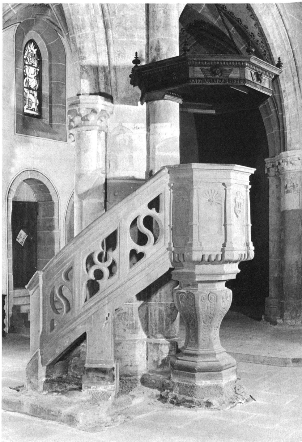
1 La chaire de l'église St.-Etienne de Moudon, de 1695, selon de modèle de la chaire de Lausanne.

cessaire 6 . Le tailleur de pierre s'engagea à exécuter la chaire «selon le projet de Maître Daniel, de la meilleure forme et ornementation possible» 7 . En 1633, le bailli, dont les armes figurent avec celles du trésorier romand sur la rampe de l'escalier, régla son compte au tailleur de pierre, maître Geörg, conformément à la convention 8 ; l'année suivante, il paya le menuisier [Charles] Laurent de Lausanne pour avoir exécuté l'abat-voix de la chaire 9 .