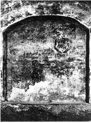
2 Messe de saint Grégoire, fresque, clocher d'Orsières. Etat avant restauration (1977).