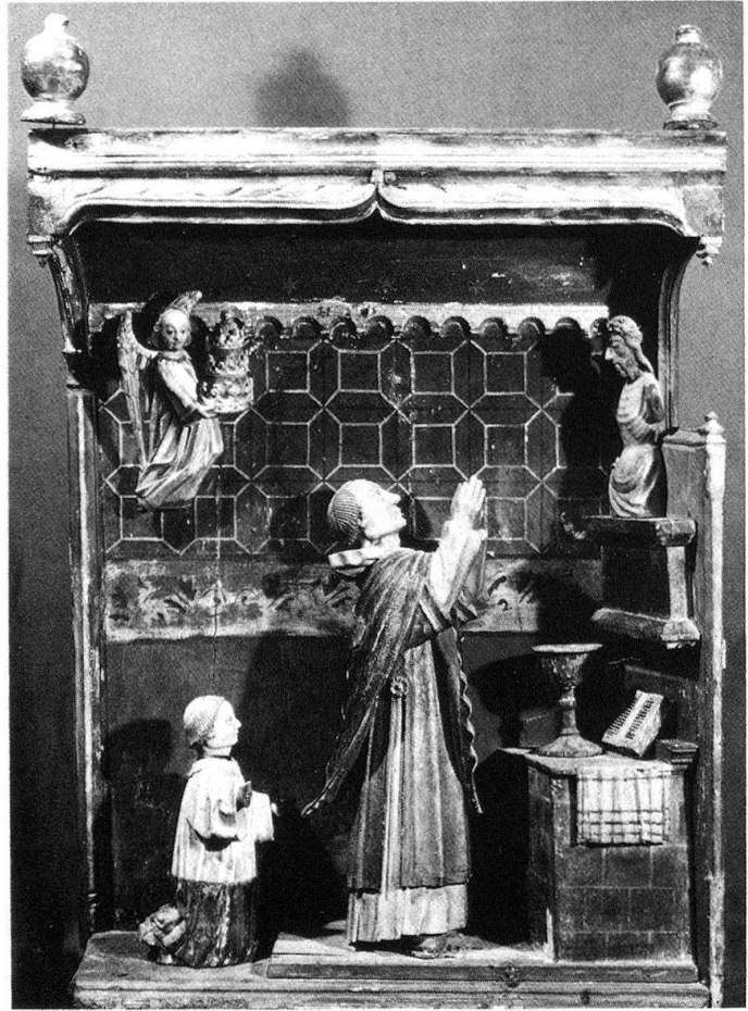
7 Messe de saint Grégoire, relief en bois polychrome, vers 1500. Château Beaulard (vallée de Suse, Piémont), église paroissiale. Toutes les figures ont disparu lors d'un vol commis en 1976!

Zusammenfassung Der Kirchturm von Orsières (VS) birgt ein merkwürdiges Wandbild. Es handelt sich um die Messe des heiligen Gregor, welche hier in einer unerwarteten und schwer zu deutenden Weise dargestellt ist. Dem Gemälde liegt ein wohl französisches Schema zugrunde, das man aber auch im westlichen Alpenraum findet. Die Malerei darf innerhalb der spätgotischen Sakralkunst der Westschweiz als isoliertes, wenn nicht gar einzigartiges Werk gelten.