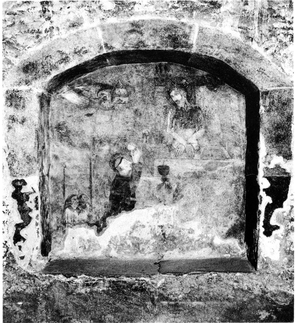
3 Messe de saint Grégoire, fresque, clocher d'Orsières. Etat après la restauration de 1984.

iii.6 D'une part, la représentation du moment de l'élévation serait issue de la « mystique rationnelle » caractéristique d'une conception française 9 . Et de fait, bien que la composition en soit tout autre, bien plus raffinée, une Messe de l'école d'Amiens ou de Bourgogne, du milieu du XV e siècle, obéit au même type qu'Orsières: élévation, deux diacres cérophores et un ange en vol porteur de tiare 10 .