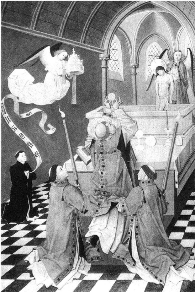
6 Messe de saint Grégoire, peinture sur bois, Ecole d'Amiens ou Bourgogne, milieu du XV e siècle, Paris. Musée du Louvre.