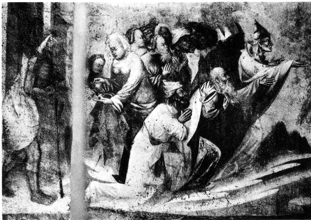
5 Campione. Santa Maria dei Ghirli. La scena dell'elemosina.

III.7 niosi, gli stessi che si vedono nell'Inferno dipinto sulla parete contigua. Qui, alcune delle torture rimaste in vista richiamano direttamente Campione e soprattutto la figura del torvo musicista goz- III.8 zuto 16 . Un particolare di accentuato realismo è costituito dalla rassegna degli oggetti accanto al calderone dei dannati, che contraddistinguono l'attività professionale di ciascuno di essi; si riconoscono significativamente l'alambicco dell'alchimista, i dadi del giocatore, ma anche la cazzuola del muratore, le forbici del sarto, etc.