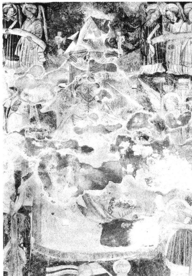
1 Campione, Santa Maria dei Ghirli. Cristo Giudice.