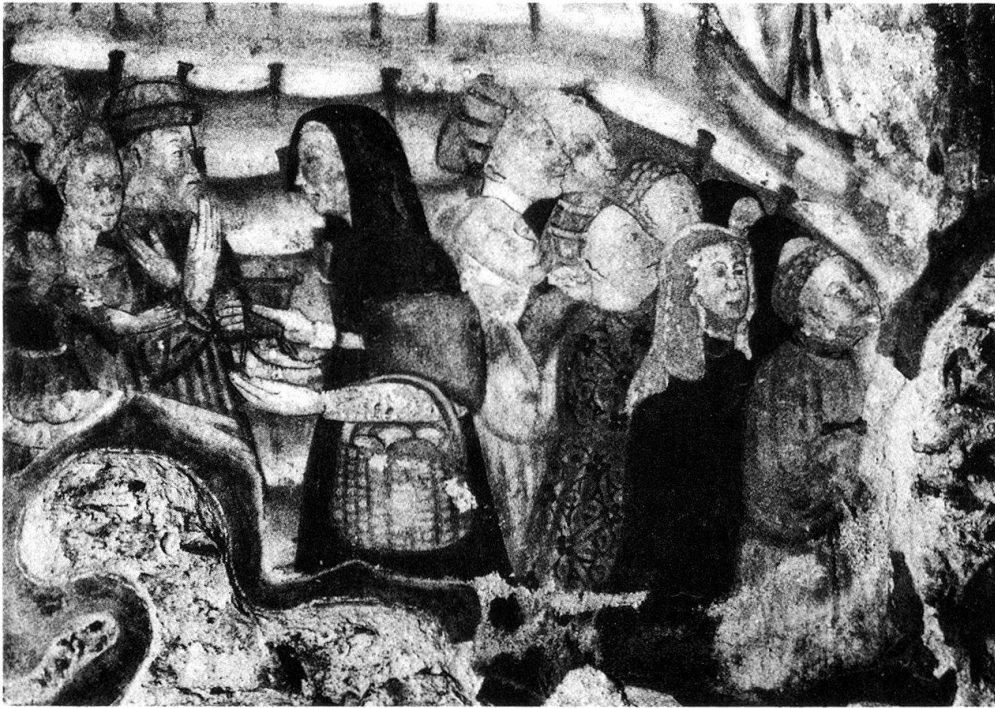
6 Cademario, Sant' Ambrogio. La scena dell'elemosina.

morti mostra piccole figurine nude, divise fra eletti (alla destra del Cristo) e dannati (alla sua sinistra). Più in basso, rovinatissimo, è l'Inferno a sfondo rosso. Fra i pochi brandelli superstiti si riconosce Giuda impiccato ad un albero, come lo si vede a Campione. Ai lati del comparto centrale, di forma rettangolare, sono raffigurati s. Sebastiano e s. Rocco (i due santi connessi per eccellenza con la protezione dalla peste) e sotto al s. Sebastiano, quindi all'estrema sinistra della composizione, come a Campione e a Cademario, ritroviamo una scena di elemosina, anche se raffigurata in modo del tutto indipendente dalle altre due versioni. Lo stile di questo pittore si fa qui quasi naif, l'anatomia delle figure rigidissime è inesistente. Lo sprovveduto artista ha fuso fra loro diversi schemi, fra cui quello campionesese. Più in alto, nella lunetta, è dipinta una Vergine in gloria, adorata dagli Apostoli inginocchiati ai suoi piedi. Anche qui, dunque, come a Cademario, fu apportato un correttivo al particolare schema iconografico di Campione, che privilegia la figura del Cristo senza minimamente accennare al culto dei Santi e della Vergine.