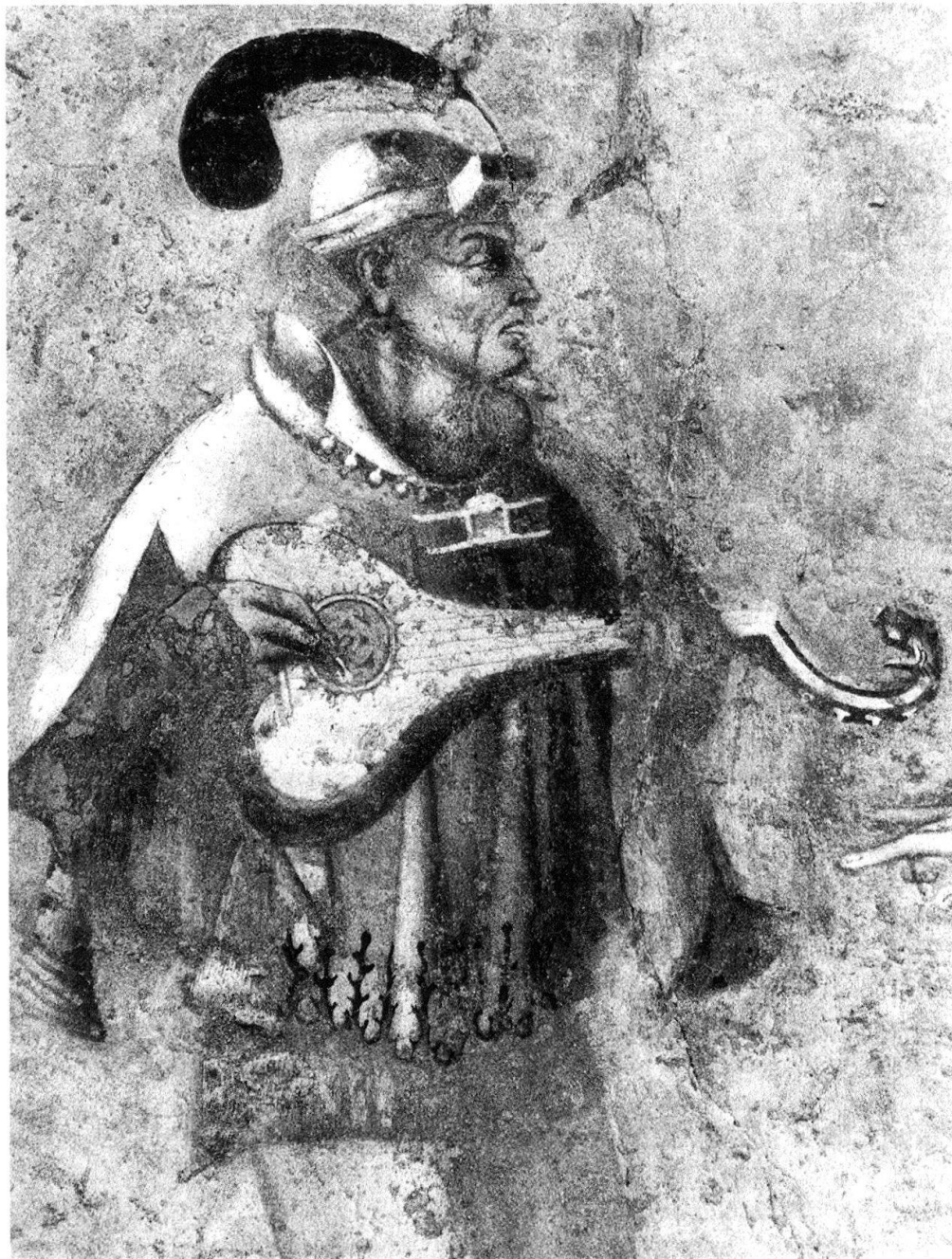
7 Campione, Santa Maria dei Ghirli. Il musicista gozzuto.

bianca a fiorellini. Purtroppo la Crocefissione ha sofferto parecchio l'umidità, ma i pochi particolari che ancora traspaiono sono di grande delicatezza, da richiamare alla mente le Crocefissioni di Crevenna e quella già a Monzoro (ora ai Musei Civici del Castello Sforzesco di Milano) 20 . Al di sotto si snoda una incantevole serie dei Mesi, eseguiti a monocromo con grande cura dei dettagli e notevole effetto plastico. Le aggraziate e ben tornite figure ricordano da vicino i fogli dei « Tacuina sanitatis » e non sfigurerebbero al paragone con i più raffinati disegni su carta del periodo, per le loro delicate lumeggiature bianche e l'armonioso inserirsi nello spazio. In particolare, la figura dell'Aprile 21 riprende con sorprendente puntualità il personaggio maschile del « Liebesgarten » integrato nel Giudizio Universale di Campione 22 . È questo un caso molto tipico e interessante in cui si può verificare la circolazione di un tema iconografico anche a vasto