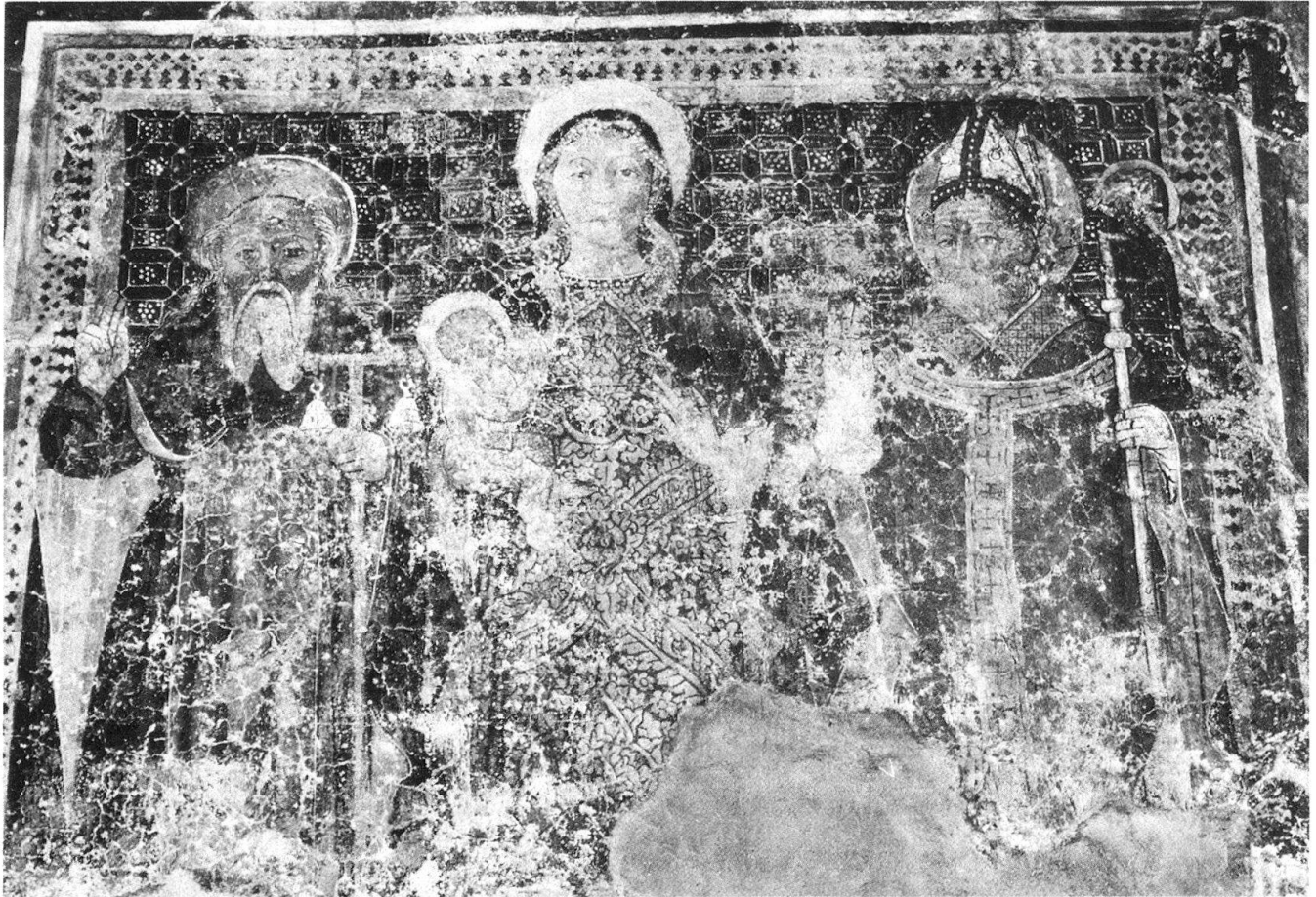
3 Mergoscia, San Gottardo. Abgelöstes Fresko mit Antonius, der Madonna und einem Heiligen, Ende 15. Jahrhundert.