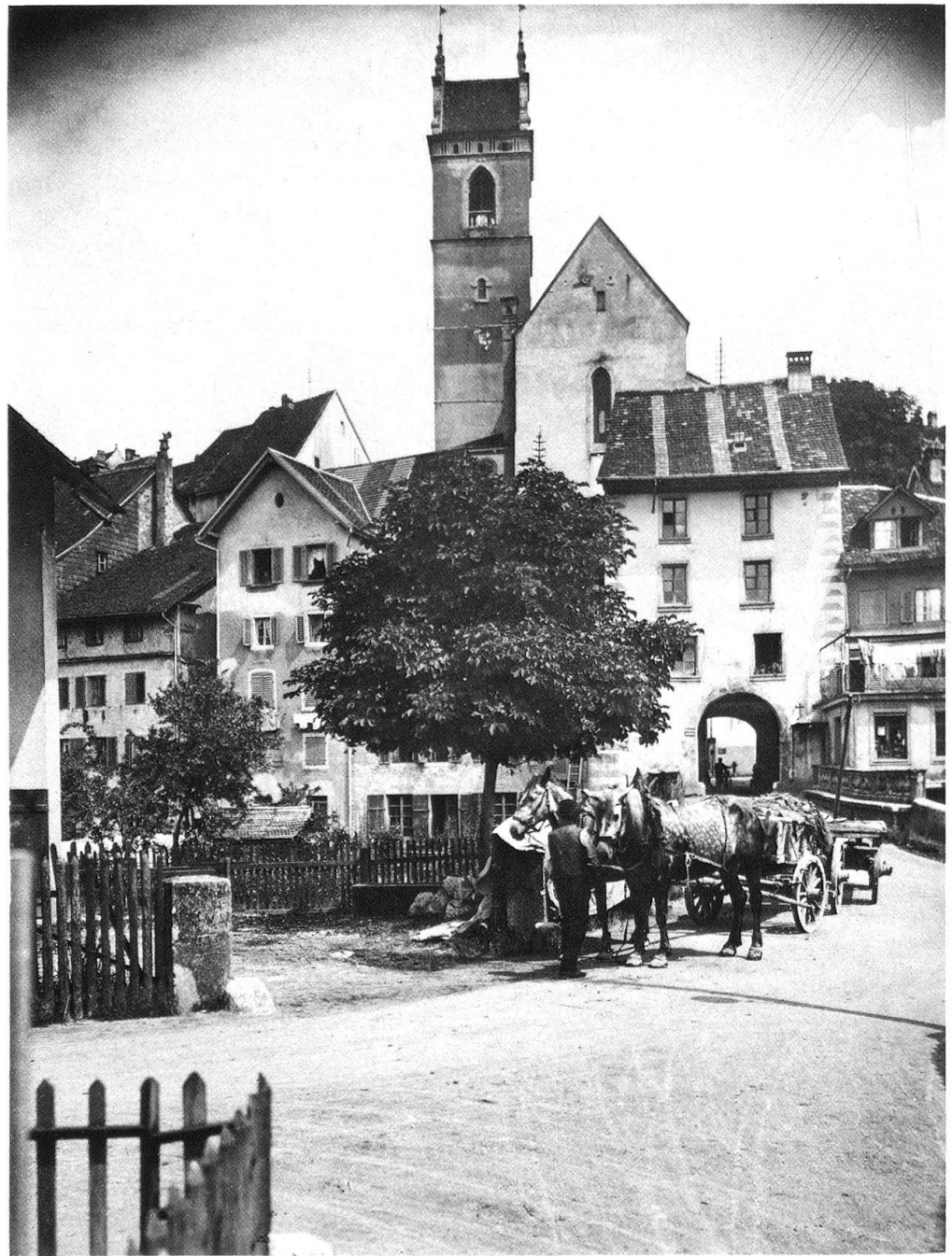
3 Aarau, das Haldentor. Nachfolgebau eines Torturms. Bauzeit zwischen 1612 und 1665. um 1920.

Heraussuchen eines unbeschadeten Ausschnitts ist ein Vertuschen der tatsächlichen Zustände – ein möglicherweise folgenschwerer Selbstbetrug. Abgesehen von den immer seltener gewordenen idyllischen Inseln, ist die Nachbarschaft unserer Denkmäler beladen von Einrichtungen des Verkehrs, der Kommunikation, der Versorgung und oft am aufdringlichsten von opulenten Werbe-Installationen. Die Blickkontrolle zeigt sofort, wie eng der Umgebungsschutz-Perimeter unserer Schutzobjekte geworden ist. «Das Denkmal im Bild» wird zum kunstgeschichtlichen Protokoll!