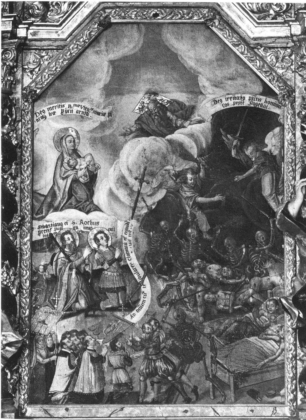
4 Altarbild des südlichen Seitenaltares der Kapelle St. Sebastian in Igels/Degen, Graubünden; ca. 1630.