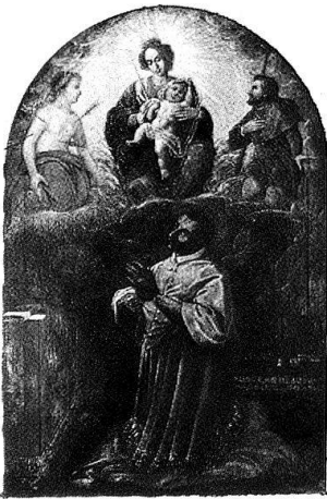
3 Votivbild mit Pestheiligen aus der Kapelle S. Carlo, Giornico, Tessin; dat. 1631.