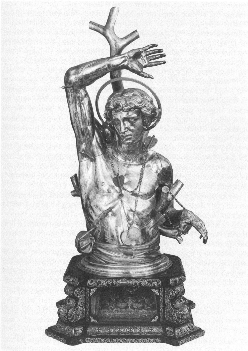
5 Sebastiansbüste, zugerisch, 1630, hölzerner Reliquienkasten darunter im 18. Jh. ergänzt.

und aussen begannen sich positiv auszuwirken. Die theoretische Voraussetzung bestand in der Überwindung der Miasma-Theorie durch die Kontagions-Theorie im Sinne Fracastoro's: Die Miasmen der hippokratisch-galenischen Medizin, giftige Dämpfe, über deren Herkunft unterschiedlich spekuliert wurde, verdarben die Luft und verursachten dadurch die lokale Häufung einer Krankheit. Erst die modernere Theorie eines kontagiösen Agens, wie sie Fracastoro erstmals 1546 formulierte, konnte die Grundlage einer wirksamen Pestbekämpfung durch Isolationsmassnahmen sein 50 . Dieser Bewusstseinswandel, dass die Pest nicht mehr unmittelbar drohte, lässt sich etwa in der Abwandlung der alten Gebetsformel aus der Allerheiligenlitanei « a peste libera nos » zum « custodi nos » fassen. Kurio-