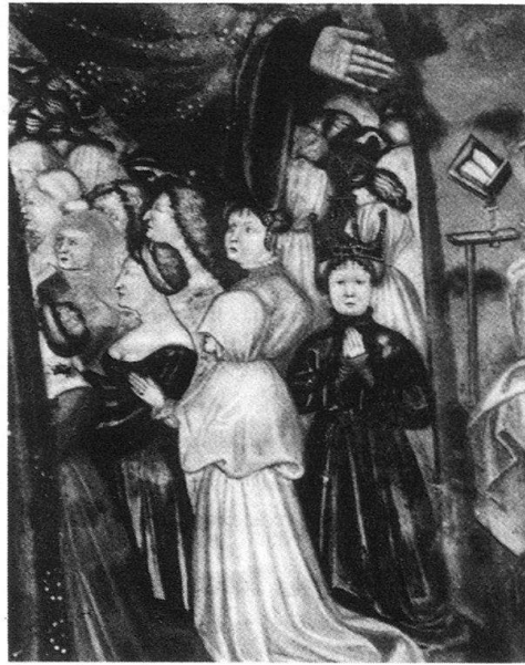
6 Castel San Pietro. La donatrice presentata da san Giovanni Battista.