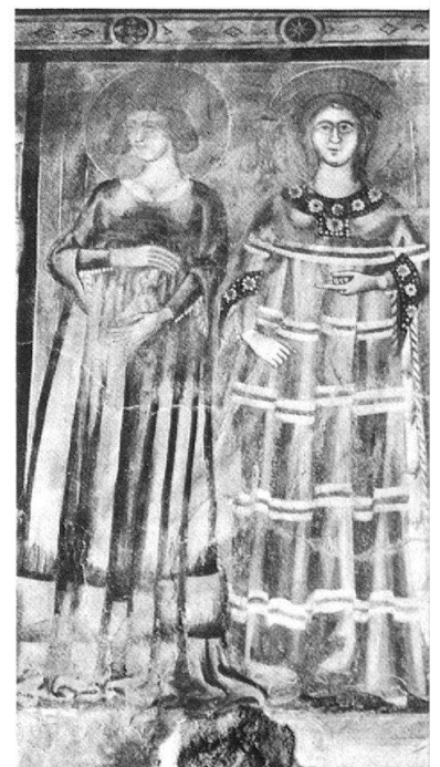
5 Pognana Lario, San Miro. Il riquadro con le due sante.