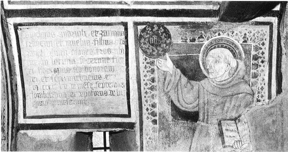
5 Lottigna. Cappella (1455).

ziario. Nello stesso ordine di idee possiamo situare un altro significativo episodio che completa e giustifica il termine di strategia utilizzato poch'anzi, rivelandoci lo stesso felice connubio di devozione e autoaffermazione sociale che caratterizza le committenze di questo ceto dirigente. Trent'anni più tardi – l'anno del celebre scontro tra gli Svizzeri e le milizie ducali – vediamo infatti operare il nipote del Bicchignoli, lui pure notaio, e il nipote di Cristoforo da Seregno, quindi la stessa famiglia di committenti – qui forse affiancata dalla collettività – e la stessa bottega d'artisti , nel coro della chiesa di San Nicola, sempre a Giornico, per l'esecuzione di un vasto ciclo di affreschi. Due iscrizioni certificano questa collaborazione: «Mcccclxxvij/die ultimo mensis/maii(?) hoc opus/finitus fuit nicola[...]/seregno de luglano/pinsit» e sotto «Mcccclxxvij/[t]ales fuerunt actores/Ser Magnus de iudicibus/et [p]etrus bichignio[li]/notarius huius ecclesie et bonorum/procuratores» 25 . Specularmente e seppur circoscritti tra le minuzie locali, i due episodi ci offrono così un prezioso spiraglio per valutare la fisionomia, non solo culturale, di questi gruppi committenti e valutare, sullo sfondo di una produzione artistica sufficientemente ampia e probante, le loro inclinazioni, le loro attese e lo spessore della loro presenza sociale, anche al di là di quanto avrebbe potuto suggerire lo statuto di notaio 26 .