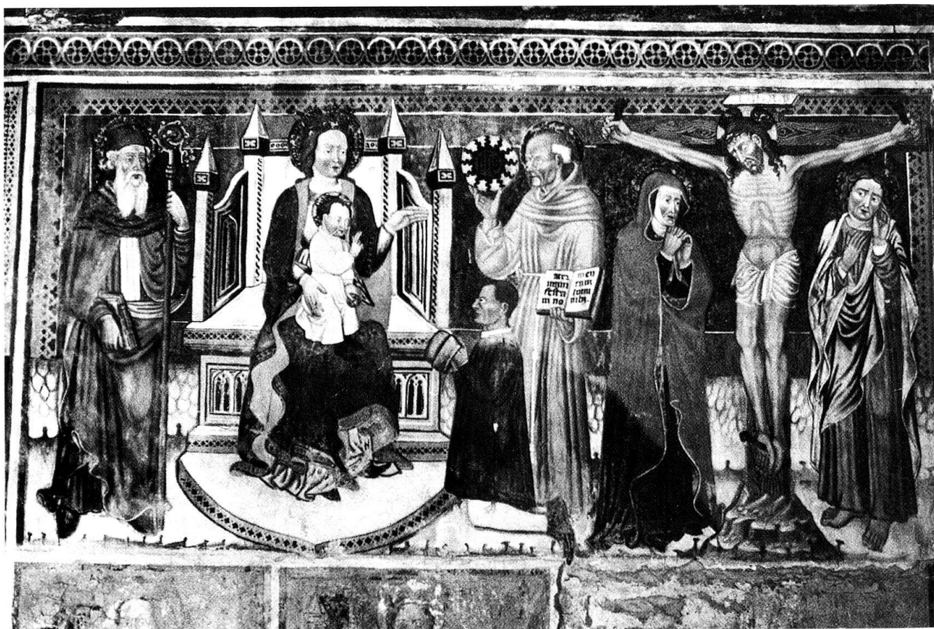
2 Prugiasco. Chiesa dei Santi Ambrogio e Carlo di Negrentino.

zeri, e comunque dobbiamo constatare la vitalità della chiesa, attraverso le opere che vi furono compiute. La lettura dei dipinti presenti nell'absidiola aggiunta rivela infatti due fasi decorative distinte: due figure, san Bernardo e san Biagio, sul lato settentrionale, riferibili alla fine del Trecento o agli inizi del secolo seguente e il ciclo del 1448, che diede al coro una veste completa, integrando armoniosamente le pitture precedenti 10 . Lo schema scelto si adegua ad un impianto convenzionale, verificabile anche nella regione su tempi lunghi 11 . La volta accoglie il Cristo in maestà, entro la consueta mandorla iridata, e i simboli degli Evangelisti; nella parte alta della parete di fondo si svolge su tutta la superficie disponibile la lotta di san Giorgio contro il drago, che delimita nel registro inferiore un ampio riquadro centrale con la Crocefissione – parzialmente occultato da un altare posteriore – e due riquadri minori, ai lati, con le figure integrali di san Vittore, a sinistra, e san Defendente sulla destra. La decorazione prosegue allo stesso livello sulle pareti laterali: una terna di santi a nord, comprendente san Naborre, san Felice e san Lucio, patrono degli alpighiani, raffigurato con il nome di «S luguzonus» 12 ; san Sebastiano e il donatore che qui ci occupa, Cristo nel sepolcro e san Placido sulla parete di fronte.