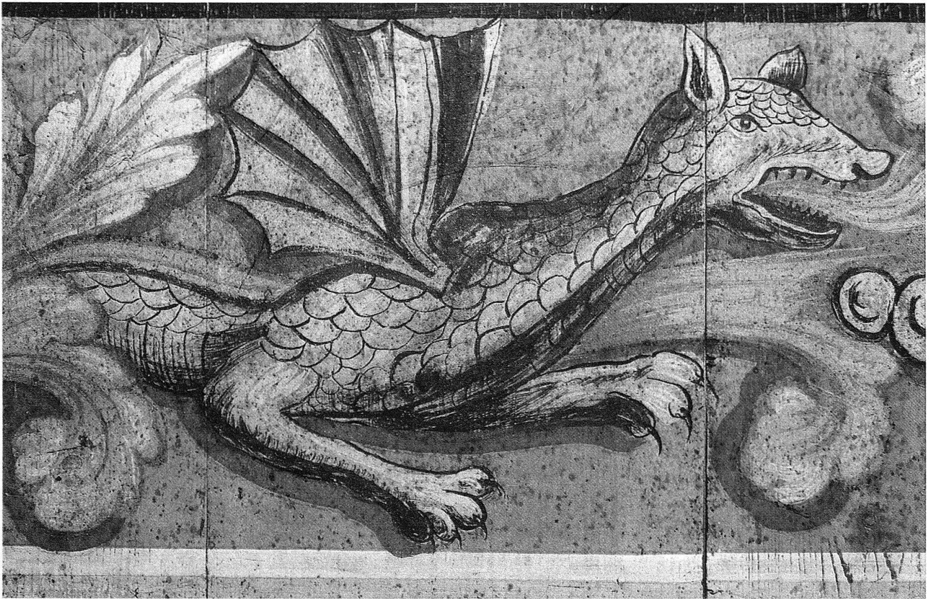
3 Moudon, détail du plafond de l'actuelle cure, vers 1696, avant restauration.

apparents. C'est aussi la période faste, comme l'attestent, en plus des exemples conservés, de nombreux textes d'archives, pour ce genre d'ornementation 13 .