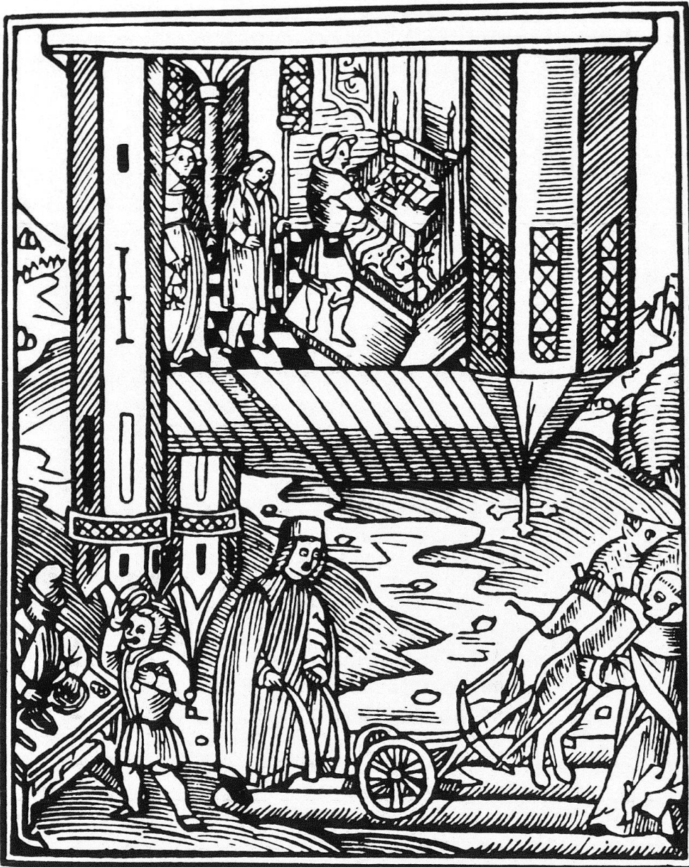
2 Bauern am Altar, Priester und Mönche am Pflug. Holzschnitt eines unbekanntes Meisters, Nürnberg 1508. Zu Beginn des 16. Jahrhunderts werden Verkehrlungen polemisch im Streit um die Erneuerung der Kirche eingesetzt, um die Haltung der Gegner als Verkehrtheit zu entlarven. Sie nehmen zwar – auch bezüglich ihrer Botschaft – oft die Motive der stereotypen späteren Darstellungen voraus, sind aber noch freier und eigenständiger.

legitimieren. Eindrückliche Belege für diese im Grunde ebenfalls konservative Botschaft bieten die Holzschritte der weit verbreiteten Einblattdrucke und Flugschriften 12 .