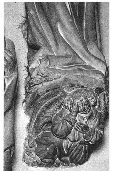
5 Culot avec un ange pleurant, sous la statue de la Vierge.

H. Reiners a insisté, à juste titre, sur les liens qui unissent les sculptures du monument de Sion à celles de la Mise au tombeau de Fribourg. Placé dès l'origine dans la chapelle fondée par Jean Mossu, à l'extrémité occidentale du bas-côté sud de la cathédrale de Fribourg, ce monument est formé de douze grandes statues en pierre polychrome, entourant le corps de Christ qui gît sur le tombeau. La date de 1433 est inscrite, sans aucune autre indication, sur le couvercle de la tombe 13 . L'auteur de la Mise au tombeau n'est pas mentionné dans les textes. Il a été nommé par la critique suisse le «Maître de la fa-