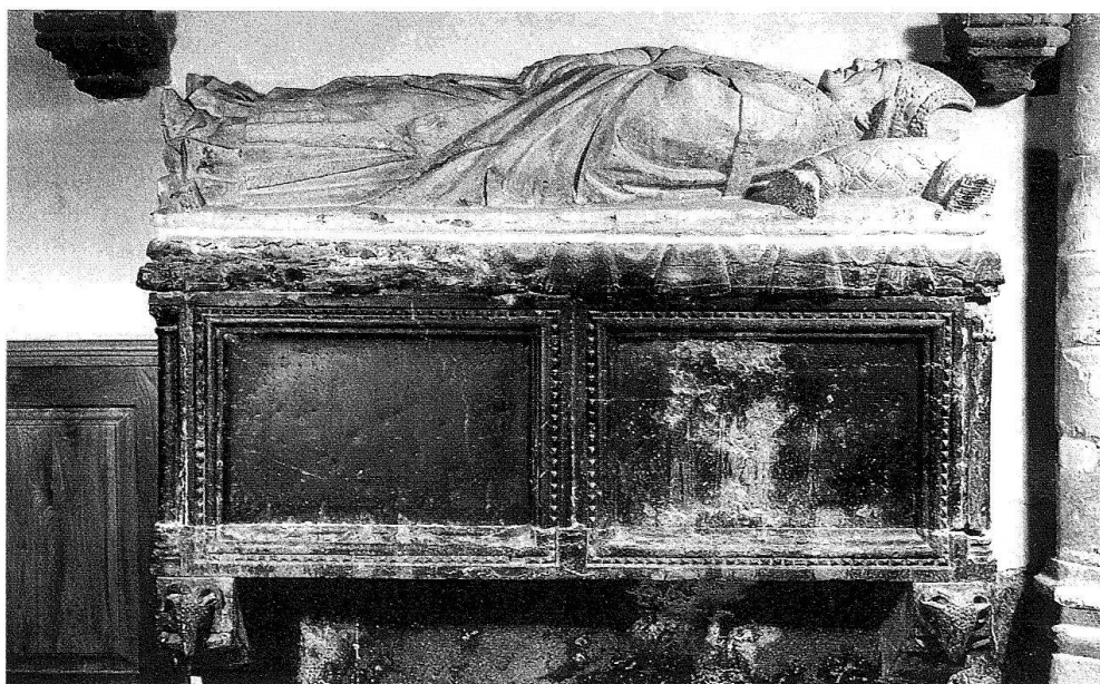
2 Sarcophage et gisant.

Heribert Reinert, dans son livre paru en 1943, nie toute influence bourguignonne directe et voit surtout dans le tombeau de Sion l'action d'un artiste en provenance de Souabe. Pour lui, «l'artiste paraît