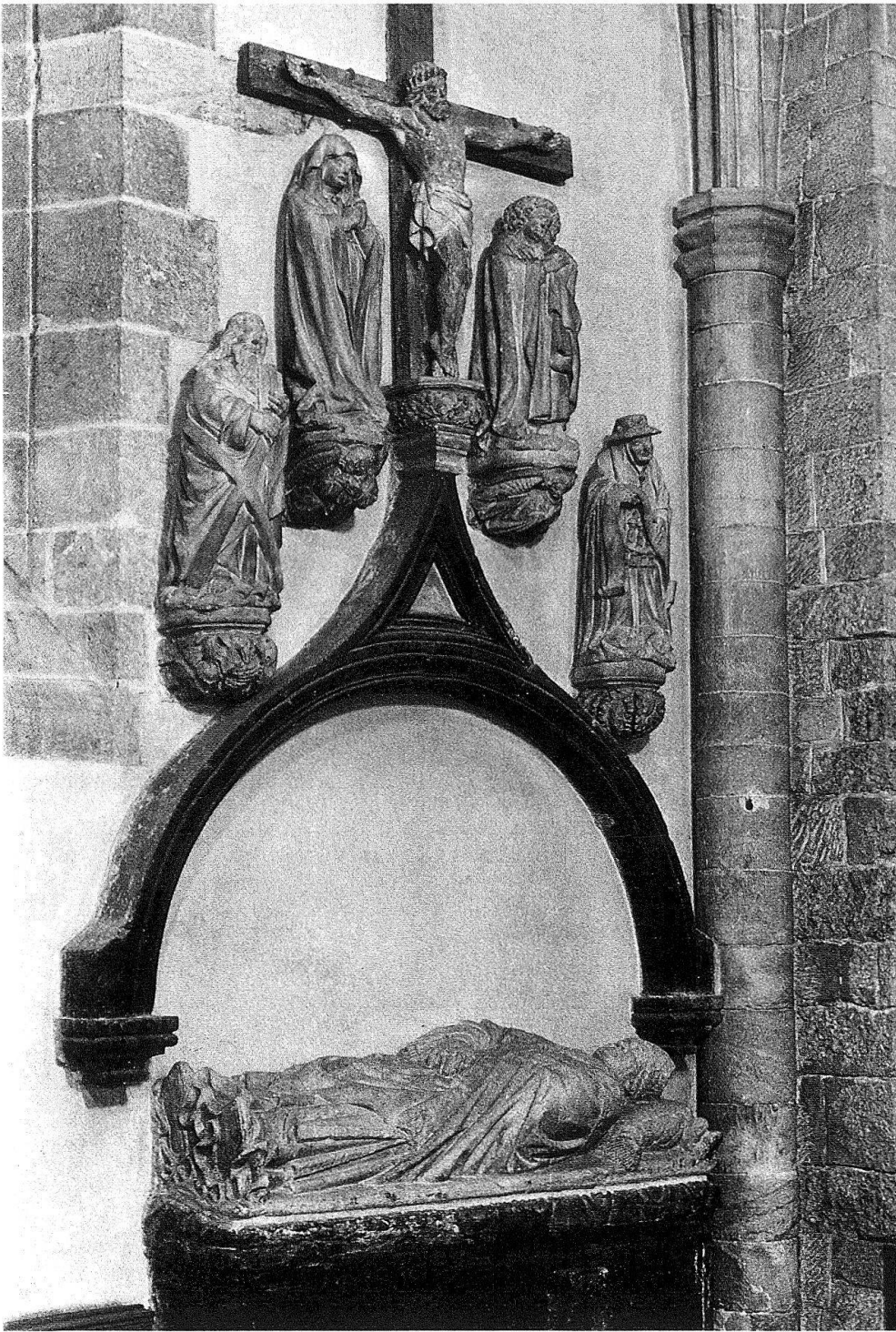
1 Tombeau de l'évêque André de Gualdo, vers 1430. Cathédrale de Sion.

boyant et la dernière colonne engagée 2 . Le sarcophage en marbre noir s'élève à environ cinquante centimètres au-dessus du sol. Il est encastré dans le mur et porté par deux consoles ornées de feuilles d'acanthé, terminées chacune par une tête de bélier, évoquant les armoiries du défunt.