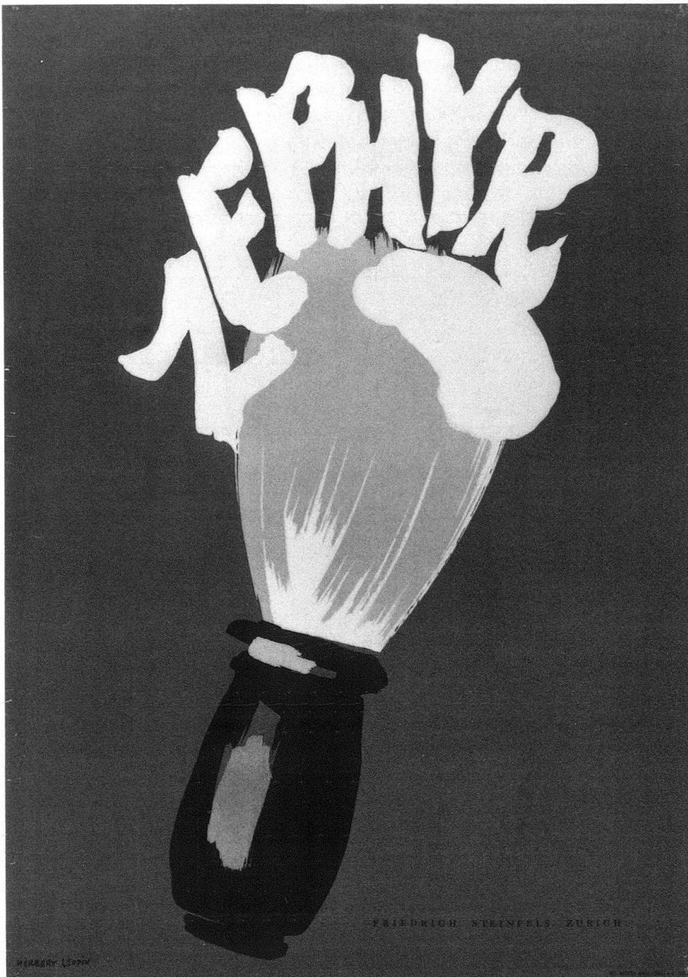
2 Herbert Leupin, Zephyr, 1948.

gehörten zur kreativsten und aufregendsten Zeit der Schweizer Plakatkunst. Otto Morach entwarf abstrahierende kubistische und futuristische Plakate, Ernst Keller vertrat als Lehrer der Grafikklassse an der Kunstgewerbeschule in Zürich die von sorgfältig komponierter Schrift und stark stilisierten Bildmotiven geprägte, strenge Plakatformulierung. «Magischer Realismus» und «Neue Sachlichkeit» kennzeichneten die Plakatsprache des Baslers Niklaus Stoecklin. «Konstruktive Graphik» gestaltete Schriften und abstrakte Flächenelemente wie Balken, Rechtecke und Kreise zu rational strengen Flächenordnungen, kombiniert mit Photos und Photomontagen zu einprägsamen Plakaten. Daneben entstanden Plakate, die sich in die un-