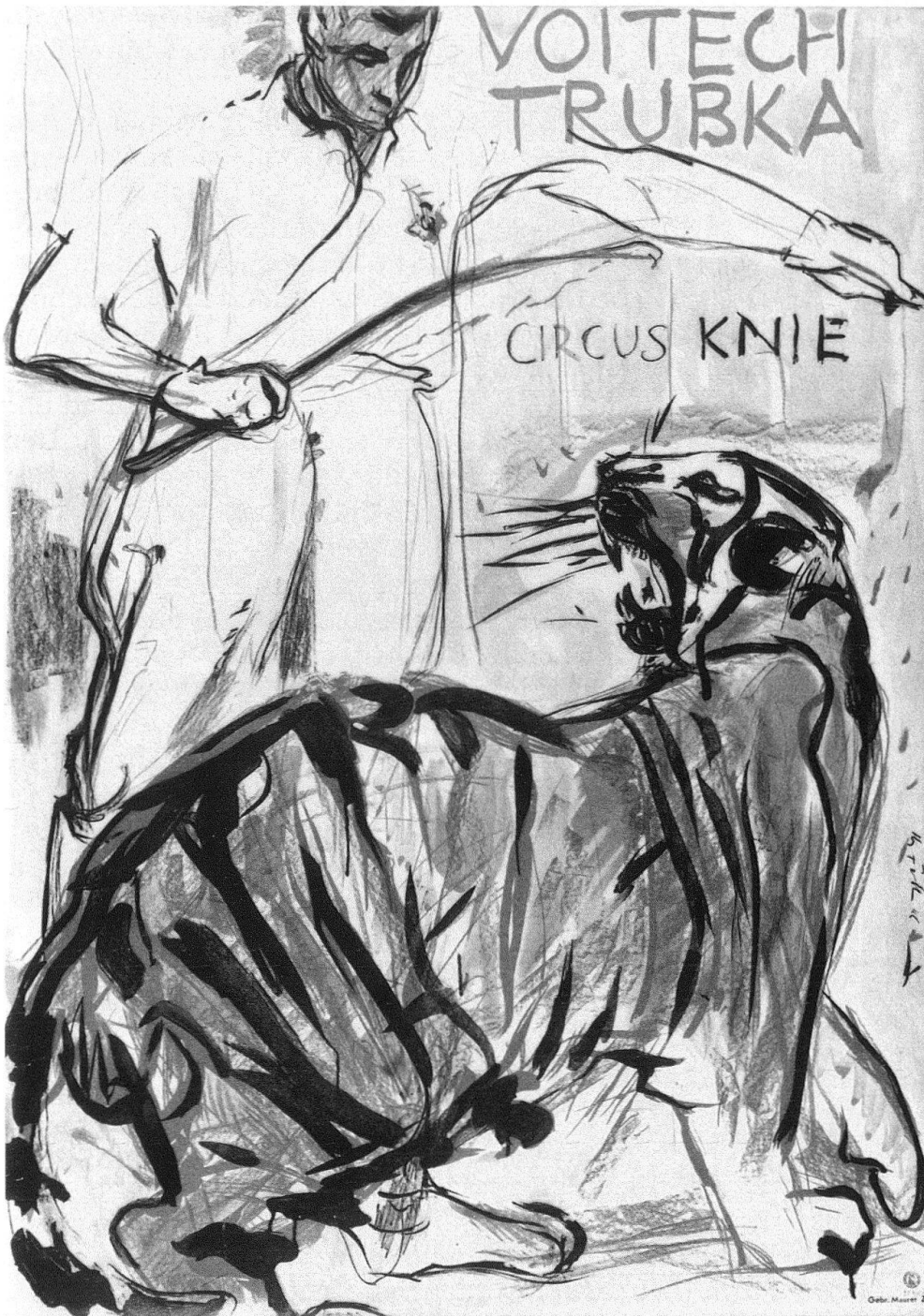
4 Hans Falk, Voitech Trubka/Circus Knie, 1946.

tropfen täuschend genau, eine Insektenbehaarung minutiös wiedergeben zu können, ertötet die eigentliche Anschauung, verurteilt den dargestellten Gegenstand zur Seelenlosigkeit 9 .» «... eine Pseudo- oder Surrogatrettung in eine Art «Heimatstil» mit erzählerisch anekdotischem Einschlag» hiess es von den Plakaten Donald Bruhns 10 . Die zeitgenössische Kritik erachtete das Fotoplakat, das allerdings im aktuellen Plakatschaffen weitgehend fehlte, als «Ausweg aus dem überspitzten Naturalismus, der ja zusehends immer mehr eine pseudo-photographische Oberflächennachbildung wird, der ohne das künstlerische Element jeder Propagandawert, auch der dokumentarische, der bei der Photographie gegeben ist, abgeht» 11 . Das Fotoplakat