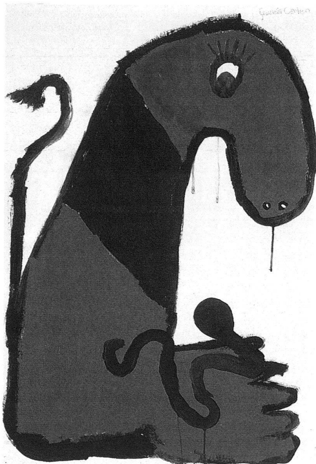
Monster von Christina Canessa, Zürich