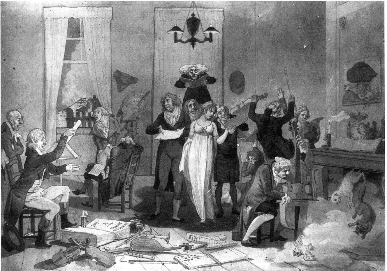
4 Le Concert d'Amateurs, env. 45×65 cm, aquarelle sur papier. Archives du Musée d'Art et d'Histoire, Genève. Provenance: ancienne collection Aimé Martinet. Avis de recherche: localisation actuelle inconnue.

quemment le trait de la plume. En revanche, les caricatures exposées en 1798 sont d'un dessin très méticuleux et réfléchi, qui est propre à la démarche de la caractérisation. Töpffer y fait preuve d'une très grande maîtrise de la technique de l'aquarelle, car même en observant ces aquarelles au microscope, on ne discerne pas de dessin sous-jacent. Ces «desseins à l'aquarelle» tels qu'ils sont décrits dans le catalogue d'exposition, participent d'une approche plus intellectuelle de la caricature, ce qui se manifeste aussi dans la perfection de leur exécution notamment par la précision du trait de l'aquarelle.