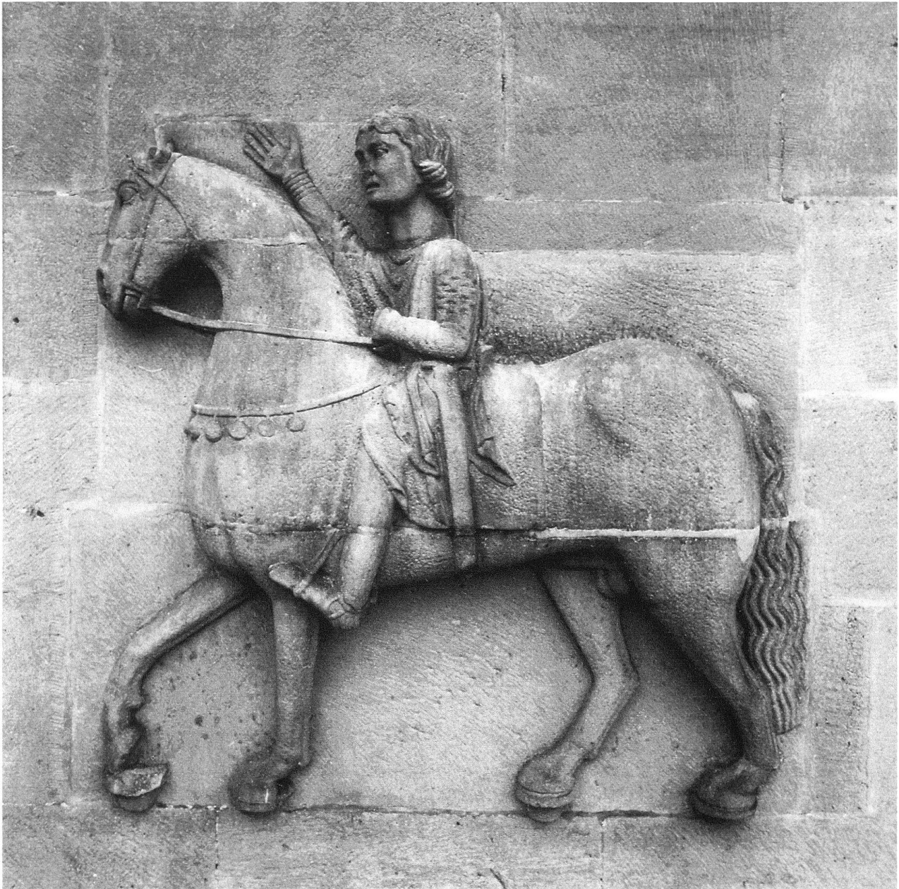
Das Hochrelief des romanischen Reiters am Nordturm des Zürcher Grossmünsters, um 1178.

Ein Rätsel gibt uns der vorzügliche Erhaltungszustand des Reiterreliefs auf. Obwohl die Figur wie die übrige Bauplastik aus demselben granitischen Sandsteinmaterial aus dem oberen Zürichseegebiet gehauen ist, musste sie als einzige noch nie überarbeitet oder in Teilen ersetzt werden. Selbst die freihängenden Zügel unter dem Kopf des Pferdes sind intakt bewahrt. Lediglich die Nasenspitze ist durch menschliche Torheit irgendwann beschädigt worden. Das Faktum des so tadellos erhaltenen Reiterreliefs ist insofern von Bedeutung, als hinter dieser Arbeit ein speziell geschulter und mit der Fassadenplastik vertrauter Bildhauer vermutet werden darf.