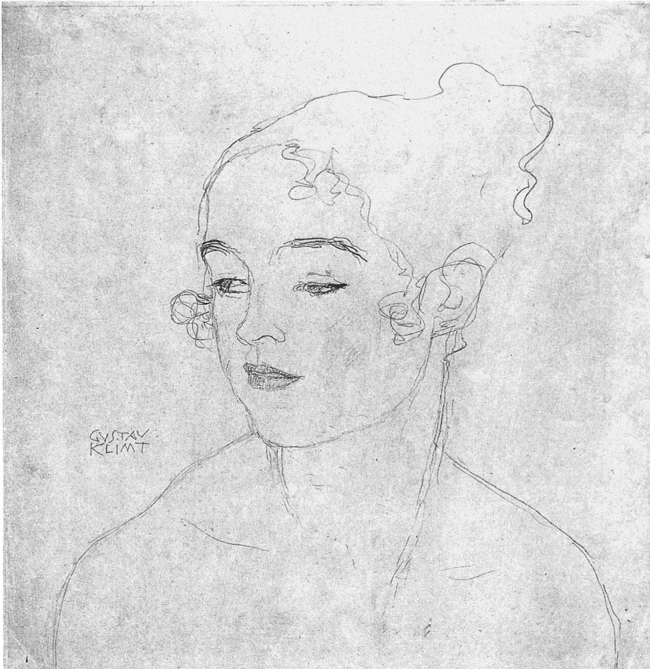
5 Gustav Klimt, Baumgarten bei Wien 1862–1918 Wien, Mädchenkopf nach links, um 1915, 35,5×34,5 cm (Bild), Bleistift und Farbstift auf Velin, Inv. 82.29.