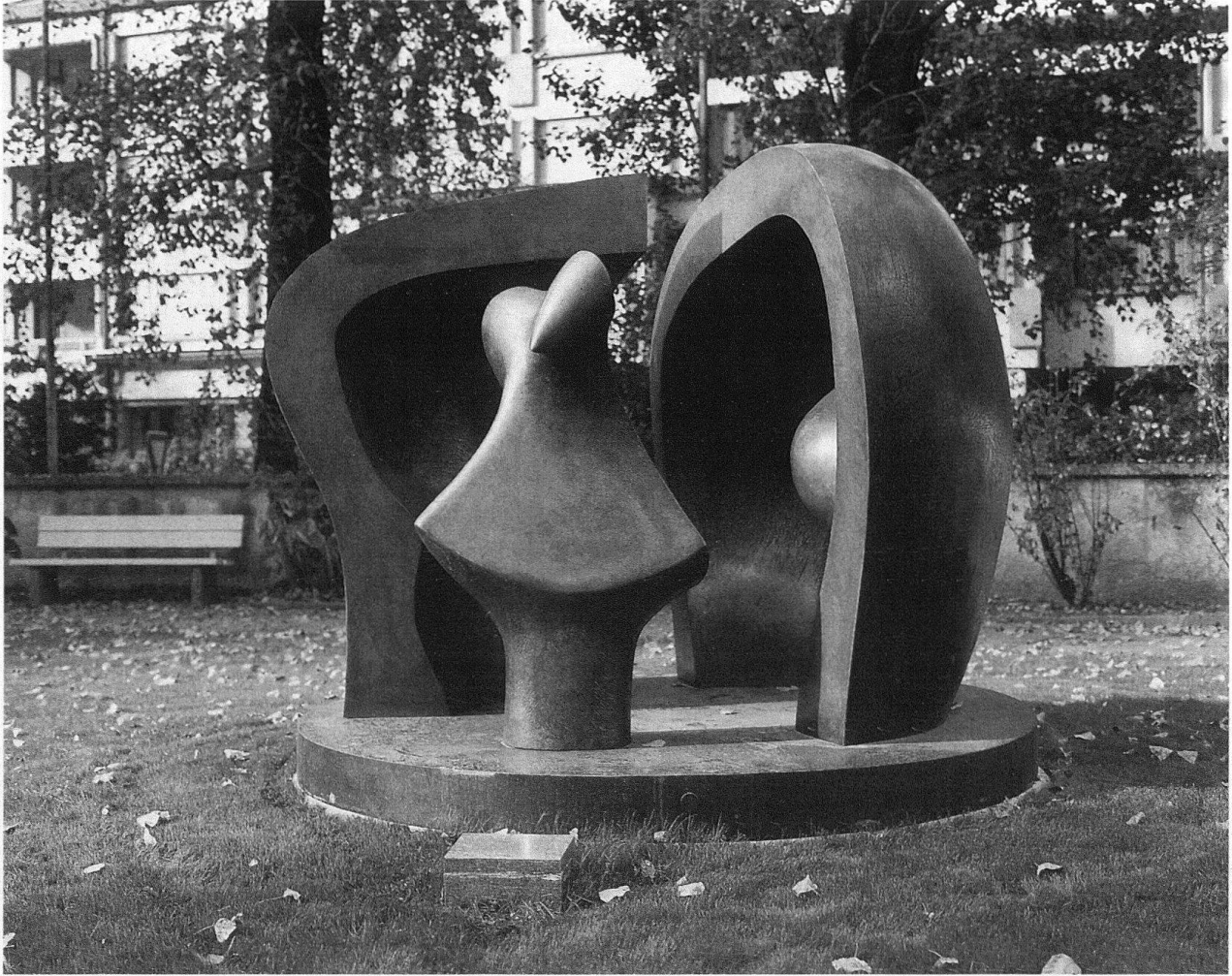
2 Henry Moore, Castleford 1898–1986 Much Hadham, Herts., Figure in a Shelter, 1983, 3/VI, 183×213,5×224 cm, Bronze, Vergabung Lampadia Stiftung Vaduz, Inv. 90.02.