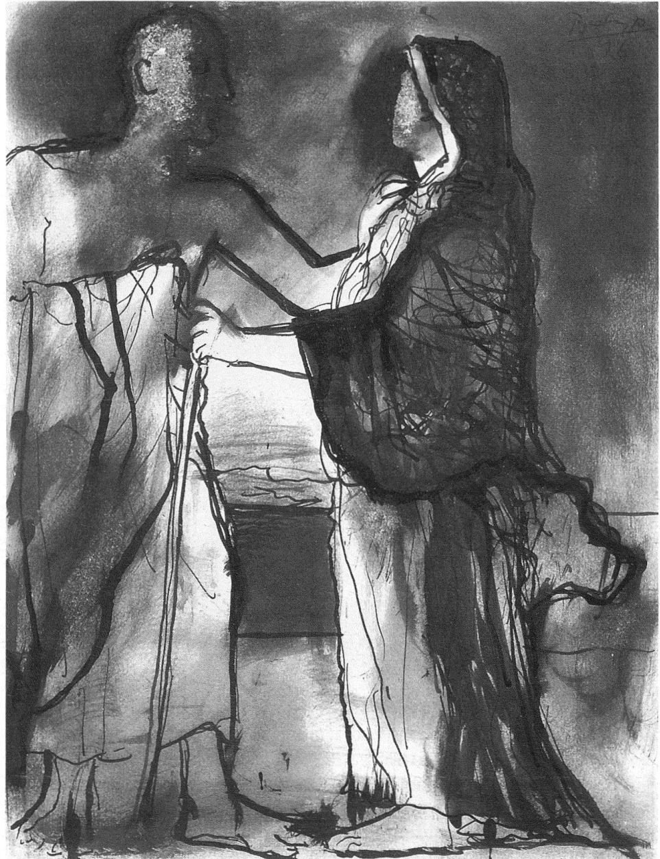
6 Pablo Picasso, Malaga 1881–1973 Mougins, Oedipe, 1926, 38,0×29,2 cm (Blatt), Encre de chine auf weissem Papier, inv. 89.01.

zung bei der Verwirklichung des Vorhabens zu. So konnte in den letzten sechs Jahren eine Reihe von Plastiken und Skulpturen erworben werden. Aufgrund dieser Voraussetzungen war es nur naheliegend, das zeitlich auf das 20. Jahrhundert limitierte Sammelziel mit Graphik im weitesten Sinn des Wortes zu raffen und das Schwergewicht der Graphikankäufe auf Bildhauerzeichnungen und Druckgraphik von Bildhauern zu legen. Trotzdem sollen die regionalen Besonderheiten in der europäischen Kulturlandschaft, soweit dies die finanziellen Möglichkeiten erlauben, nicht vernachlässigt werden 9 .