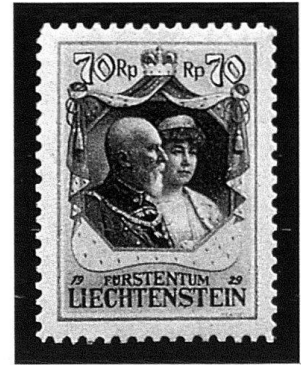
2 Briefmarke FL, 70 Rp., 1929, Furst Franz I. und Furstin Elsa.

Als Markenmotive fur die Liechtensteiner Wertzeichen erfreuen sich Portrats von Angehorigen des Furstenhauses und Abbildungen von Schatzen aus den weltberuhmten, wahrend Generationen aufgebauten furstlichen Sammlungen besonderer Beliebtheit. Furst Johann II. kam 1928 nochmals zu Briefmarkenehren: Zu seinem 70. Regierungsjubilaum erschienen sieben Portratmarken, wobei die hoheren Werte in origineller Weise sein Bild als junger Mann beim Regierungsantritt 1858 und ihn daneben siebzig Jahre spater mit weissem