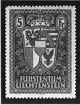
1 Briefmarke FL, 5 Fr., 1935, Landeswappen (R. Junk).