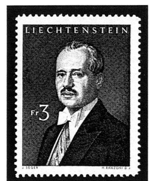
4 Briefmarke FL, 3 Fr., 1960, Furst Franz Josef II. (J. Seger, H. Ranzoni d. J.).