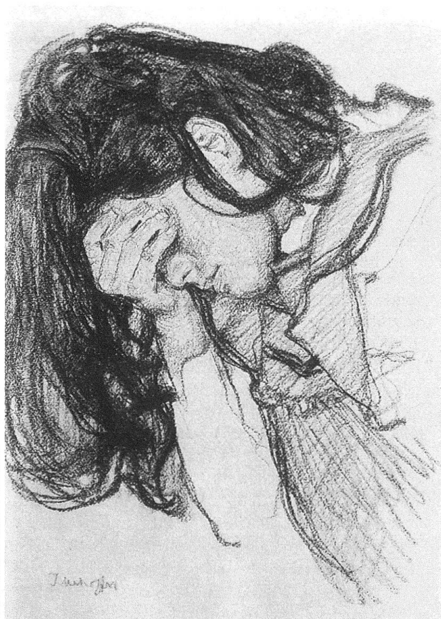
3 Studie zum trauernden Mädchen bei der toten Katharina, Kohle auf Papier.

seln nebeneinanderlegt und dadurch den flächenhaften Charakter der Jugendstilmalerei betont. Ein weiteres Gestaltungsprinzip des Jugendstils, die von der japanischen Druckgraphik beeinflusste Asymmetrie, schafft Blickpunkte, die zur Rhythmisierung und Dynamisierung der Darstellung führen. So etwa durch das grosse Rad, Attribut der Hl. Katharina, das in dieser Fensterbahn kein Gegengewicht erhält, oder durch die verschiedenen Stellungen der toten Märtyrer. Dies steht in eigenartigem Gegensatz zu der symmetrischen Wiederholung der gotisierenden Dienste und der Irisbeete. Interessant bei Mehoffer ist, dass er mit gegensätzlichen formalen Prinzipien arbeitet, die eine zusätzliche Spannung bewirken.