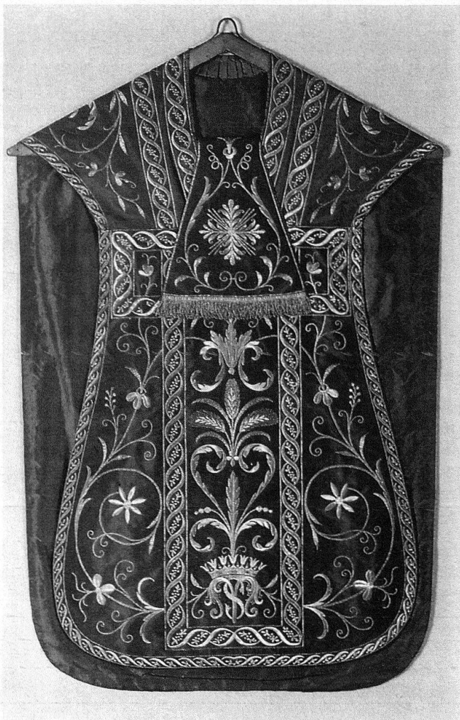
Cadro

Dai dati esaminati emerge chiaramente che in una zona non certo ricca ma con una solida tradizione artistica e artigianale (anche se soprattutto praticata all'estero dagli emigranti) tutti gli arredi ecclesiastici venivano molto considerati, curati, e valutati non solo per la loro connotazione sacra legata ai riti chiesastici o devozio-