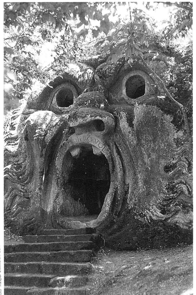
Bomarzo, Parco dei mostri.

1. Tag: Flug von Zürich nach Rom. Fahrt mit dem Bus vom Flugplatz nach S. Martino al Cimino (Standort des Hotels während der ganzen Reise)