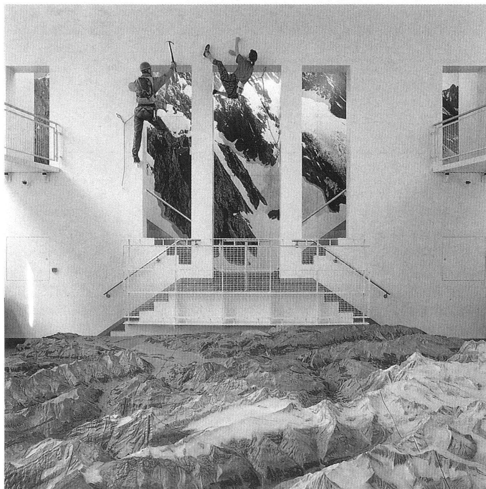
4 Eiskletterer und Freikletterer in Lebensgrösse. Zwei Figuren von Bildhauer Werner Müller, Luzern. Sie bilden die moderne Ergänzung zu den Hodler-Bildern auf der Gegenwand. Blick über das Relief des Berner Oberlandes zur Westwand des Saales.