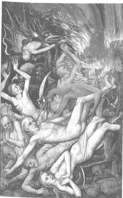
Gruppe von Verdammten in der Hölle, Detail aus einer Weltgerichtsdarstellung. Triptychon um 1480, Privatsammlung.

wusst sind, wollen wir in unserer Ausstellung verständlich machen.