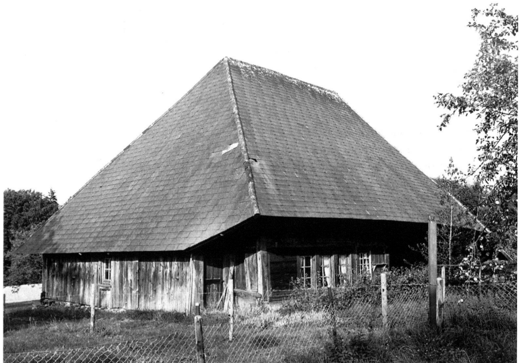
1 Gemeinde Schüpfen, Chaltberg 435, Taunerhaus von 1655. – Weitgehend unverändert erhaltener Boblenständerbau mit Hochstudkonstruktion und reichen Details. Eines der ältesten bäuerlichen Gebäude in der Gemeinde. Einstufung: schützenswert. (Inventarisierung und Foto: Erwin Daepf, Schüpfen)

Ungewohnt rasch erfolgte in Bern die gesetzliche Verankerung: Bereits 1970 enthielt die kantonale Baugesetzgebung den Auftrag an die Kantonale Denkmalpflege, das «Hinweisinventar alter Bauten und Ortsbilder für jede Gemeinde zu führen». Das eidgenössische Raumplanungsgesetz verpflichtete ab 1979 Kantone und Gemeinden, Schutzzonen und Schutzobjekte zu bezeichnen, zu denen unter anderem Ortsbilder und Kulturdenkmä-