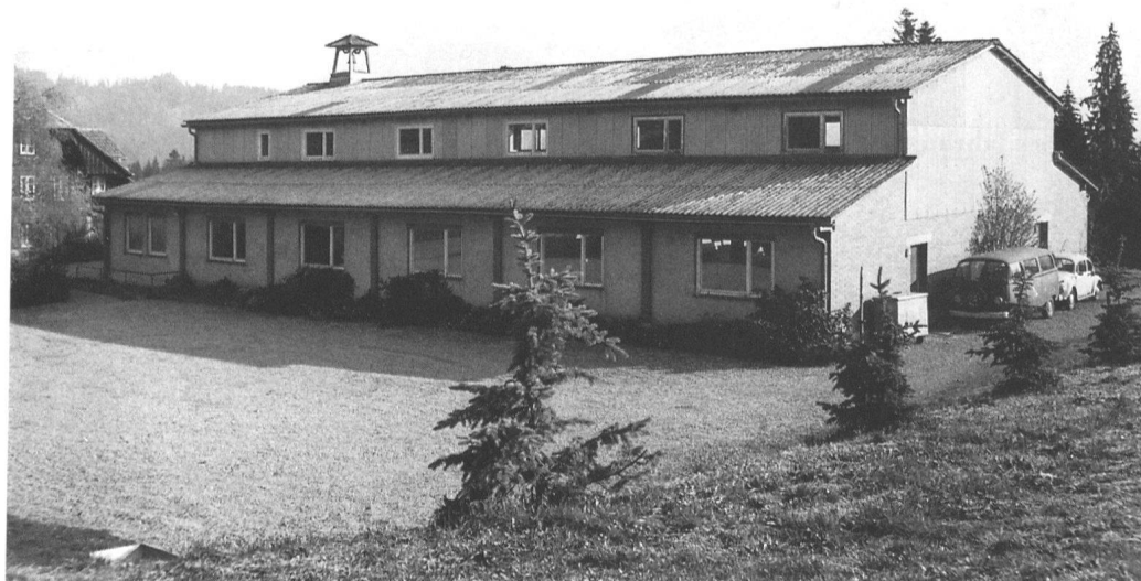
12 Gemeinde Signau, Hasli 265 K, Kirche der Gemeinde für Urchristentum von 1958. – Einfacher Putzbau mit basilikalem Querschnitt. In Lage und Ausprägung einmaliger Bau mit dem Bekenntnis entsprechenden typologischen Bezügen. Einstufung: erhaltenswert. (Inventarisierung Hans-Peter Ryser, Kant. Denkmalpflege, Bern)

sante Vertreter der neuen Bauaufgaben des 19. und frühen 20. Jahrhunderts, und vor charakteristischen Bauten des Neuen Bauens und der Architektur der 1940er und 1950er Jahre wurde ebenfalls nicht Halt gemacht.