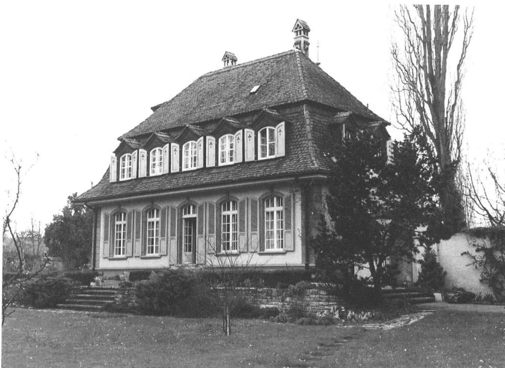
10 Gemeinde Thun, Dürrenast, Seestrasse 53, Villa des Thuner Architekten Alfred Lanzrein von 1929. – Repräsentativer Putzbau mit hohem Mansarddach und fein gearbeiteten Kunststeingliederungen; inspiriert von bernischen barocken Landsitzen. Gehört zu den überzeugendsten Villenbauten dieser Epoche in Thun. Einstufung: schützenswert.

Im Gegensatz zum Hinweisinventar, das Bauten bis um 1920 berücksichtigte, wurde die Aufnahmezeitgrenze aufgehoben. So finden auch allerneueste, qualitativvolle Gebäude Eingang ins Inventar, wobei die Objekte der letzten 30 Jahre ohne Bewertung dokumentiert werden. Aber Architekturbeispiele des Neuen Bauens oder soziale Siedlungsarchitek-