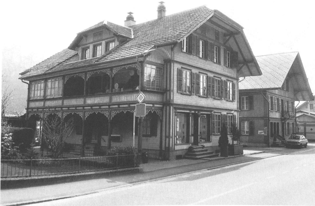
9 Gemeinde Trubschachen, Dorfstrasse 15, Wohnhaus von 1907 mit Coiffeursalon. – Horizontal verschalter Ständerbau mit dekorativen Lauben. Weitestgehend im Originalzustand erhaltener, gut proportionierter Bau mit einfachen aber dekorativen Details. Einstufung: schützenswert.

(Inventarisierung und Foto: Peter Bannwart, Bern)