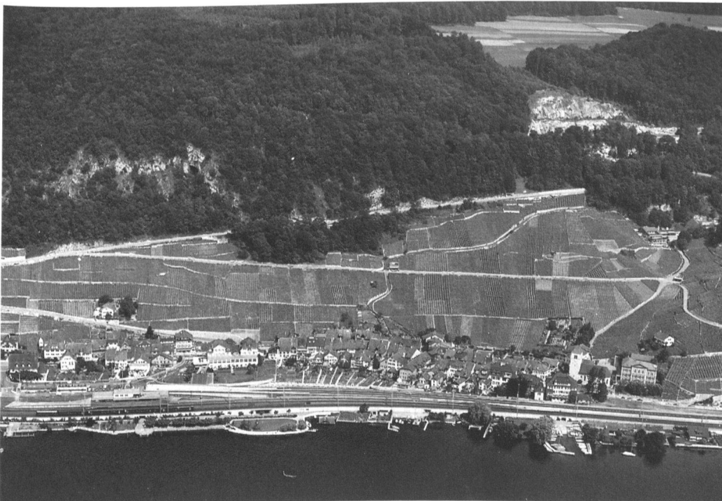
3 Twann, Rebenschutzzone: Erste Landwirtschaftszone – ohne Baumöglichkeit – im Kanton, genehmigt 1936. Die von den Gemeinden am Nordufer des Bielersees erlassene Rebenschutzzone diente sowohl der Sicherung des Rebbaues wie der charakteristischen Ortsbilder. Als Ortsbildschutzmassnahme wurden damals auch Uferabschnitte seeseits der Dörfer, als sogenannte Reservate, ausgeschieden und mit Bauverbot belegt. Schwere Schäden bringt der Nationalstrassenbau.

Die Eidgenossenschaft bezeichnet den Ortsbildschutz und den Schutz der Erscheinung von Denkmälern, also von deren schutzwürdiger Umgebung, erstmals im Bundesbeschluss zur Förderung der Denkmalpflege von 1958