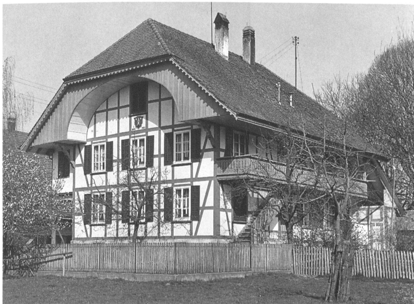
7 Niederösch: Beispiel eines im Hinweisinventar als «in der Gesamtform erhaltenswert» eingestuftes Stocks von 1883. Der ursprünglich erhaltene Bau wurde nicht zuletzt wegen seiner dem Inventaristoren bekannten guten Innenausstattung aufgenommen.

Inventar wertet die Bausubstanz in fünf Stufen: Besonders wertvoll, wertvoll, Gesamtform erhaltenswert, ohne Einstufung und störend. Besonders wertvolle Objekte sind unter allen Umständen zu erhalten. Dem Objekt wie seiner Umgebung wird verstärkter Schutz zuerkannt. Diese Kategorie dient quasi als Überklasse von regional und national gesehen bedeutenden Objekten. Wertvolle Objekte umfassen den bedeutenden Baubestand, welcher im Ganzen der Ortschaft deutlich hervortritt. In der Gesamtform erhaltenswerte Objekte umfassen vor allem charakteristische einfache Bauten, die qualitativ das Ortsbild ausmachen. Oft wirken sie erst gemeinsam überzeugend und werden so zur als wertvoll einzustufenden Baugruppe. Die Kurzbeschreibungen zu den Objekten sollen die Wertung erläutern, ob der Bau als wichtiger Teil einer Gebäudegruppe oder wegen seines Eigenwertes zu erhalten oder zurückzurestaurieren sei oder ob