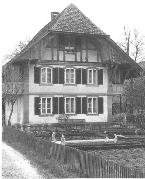
6 Niederösch: Beispiel eines im Hinweisinventar als «wertvoll» eingestuftes, schmuckes, ursprünglich erhaltenes Stöckli mit Ofenhaus, welches sich durch qualitativ hochwertige Sandsteingliederung und gute Zimmermannsarbeit auszeichnet, erbaut 1821.

Das Hinweisinventar ist als Einzelobjekt-Kurzinventar angelegt. Es baut, vom Einzelgebäude ausgehend, dieses wertend beschreibend, über die ausgeschiedenen, ebenso bewerteten Baugruppen, das Ortsbild als ein Ganzes auf. Es wertet primär das Einzelobjekt. Das Kurzinventar soll in erster Linie der täglichen Baubewilligungspraxis dienen. Das