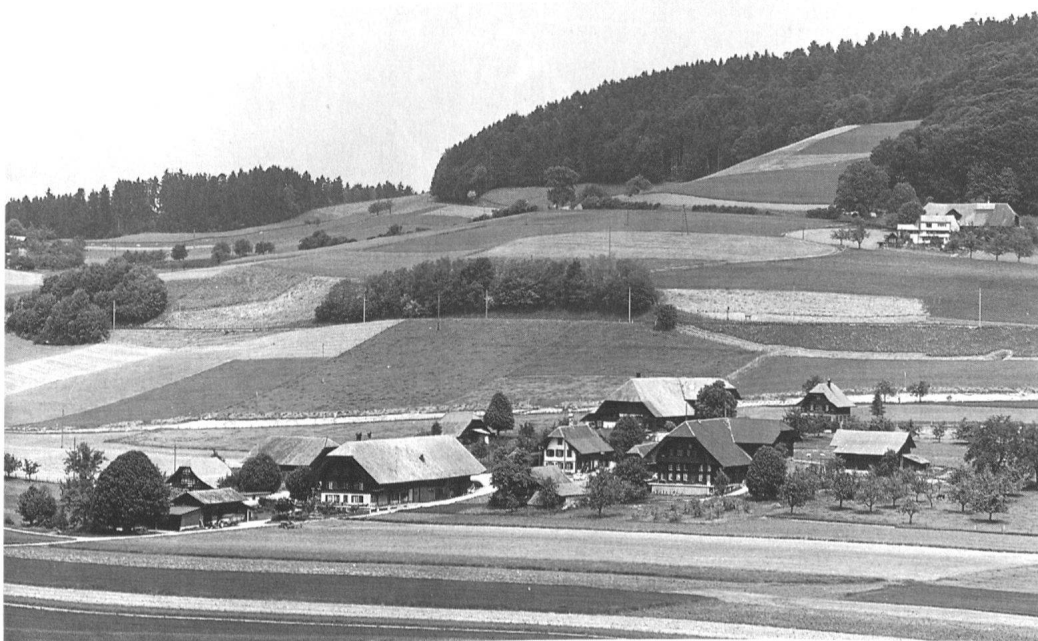
10 Aemligen (Gemeinde Tägeretschi): Beispiel einer Hofgruppe guter Qualität, welche vom ISOS, da zu klein (Aufnahmeschwellenwert mindestens zehn Hauptbauten), nicht bewertet wird.

Die provisorischen Schutzgebiete konnten nur über eine dem neuen Baugesetz genügende Ortsplanung abgelöst werden. Dies motivierte die Gemeinden, ihre Ortsplanung zügig voranzutreiben. Im Blick auf kommende Hinweisinventare bewertete der Bearbeiter die Altbausubstanz vieler Gemeinden, begutachtete Schutzperimeter und Kernzonenabgrenzungen der zur Vorprüfung eingereichten Planungen. Die Inventarproduktion liess sich