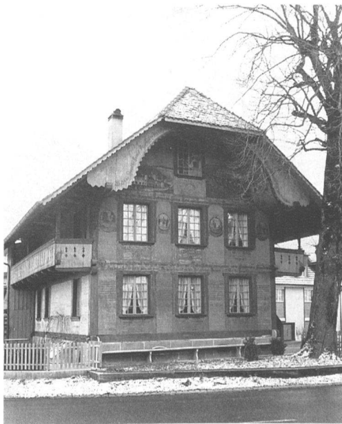
12 Niederscherli (Gemeinde Köniz): Der Herrenstock – einer der wenigen vollständig bemalten, spätbarocken Ründestöcke des Kantons, erbaut 1784 – sollte wegen des geplanten Strassenausbaues um 30 Meter von seinem heutigen Standort zurückverschoben werden. Durch eine solche Versetzung wäre der Stock um seine charakteristische Stellung am Strassenkreuz am oberen Ende des Staldens gebracht worden; auch die Spruchbemalung hätte damit ihren Sinn verloren. Dank dem Widerstand gegen die Ausbaupläne konnten der Stock am alten Standort erhalten und restauriert, der Ortskern vor Zerstörung bewahrt werden.

Das gestützt auf Artikel 22 quater der Bundesverfassung im zweiten Anlauf 1979 angenommene Raumplanungsgesetz verlangt unter anderem, dass die Planungen koordiniert und die Grundzüge der zukünftigen Entwicklung festgelegt werden. Als Nutzungspläne werden neben den Bauzonen neu die Landwirtschaftszonen und, für die Ortsbildpflege wichtig, die Schutzzonen eingeführt. Letztere sollen u. a. «bedeutende Ortsbilder, geschichtliche Stät-