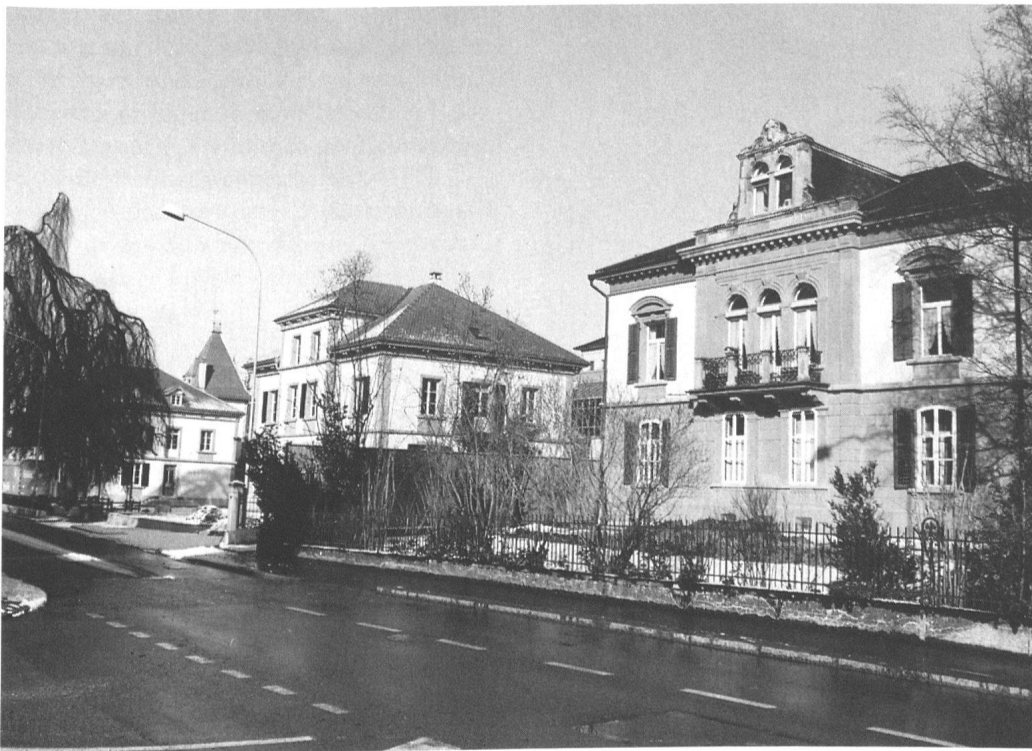
2 Langnau, Schlossstrasse: Vorzügliches Villenquartier der 1870er Jahre. Die Bebauung wurde geordnet durch Aligementsplan und Dienstbarkeiten, welche unter anderem den Gebäudeabstand zur Strasse festlegten. Übliche Art der Quartiererschliessung vor dem 1894 erlassenen Gesetz betreffend die Aufstellung von Aligementsplänen und baupolizeilichen Vorschriften des Kantons.

Bis zum Inkrafttreten des Gewässerschutzgesetzes 1971 mit seinen limitierenden Verpflichtungen zum Anschluss ans Kanalisationsnetz kann in vielen Gemeinden (abgesehen vom seit 1902 landesweit geschützten Wald) überall gebaut werden. Nur Städte und grössere Dörfer hatten eigene Bauordnungen mit Bauzonenplänen. Die Geschosszahl der Bauten bestimmt sich weitgehend an der Länge der Feuerwehleiter. Die Bautätigkeit wird geordnet durch Aligementspläne, welche die Verkehrswege sichern sollen, durch feuer- und gesundheitspolizeiliche sowie nachbarrechtliche Vorschriften und Dienstbarkeitsver-