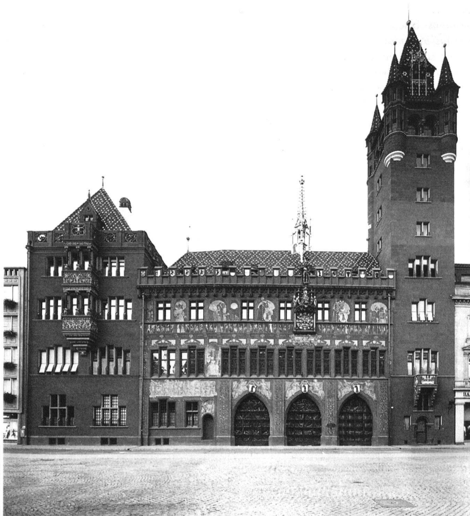
Basel, Rathaus, Marktplatzfassade, 1507/13, 1606/08 und 1898/1904.

Ihnen sei wärmstens empfohlen, die Ankündigungen und Kommentare in den Medien zu beachten und vom Tag der Kulturgüter zu profitieren. Fast durchwegs werden Sie die Gelegenheit bekommen, üblicherweise für das Publikum nicht zugängliche Objekte und Räume unter kundiger Führung besichtigen zu dürfen. Die Initianten werden darüber hinaus für alle Objekte illustrierte Unterlagen bereitstellen, die auf kurzweilige und verständliche Art Wissenswertes vermitteln und auf allerlei Merkwürdigkeiten aufmerksam machen. Regionale Schwerpunkte erlauben ohne weiteres, am selben Tag auch mehrere Objekte zu besuchen. Es bestehen also gute Aussichten auf einen erlebnisreichen Tag!