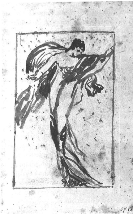
Arnold Böcklin, projet pour «La nuit», 1895, pinceau et encre, 17×11,4 cm. Öffentliche Kunstsammlung Basel.

Le répertoire iconographique et le volume d'illustrations qui figurent en annexe à ce travail rendent compte de l'importance