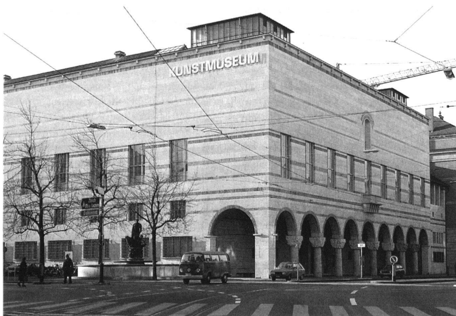
Basel, Kunstmuseum, 1933–1936 von Rudolf Christ und Paul Büchi erbaut.

Einen inhaltlichen Zusammenhang zwischen traditioneller Architektur und konservativer Politik wurde den Verantwortlichen jedoch von Kritikern, die vorwiegend aus den Reihen der Verfechter des Neuen Bauens stammten, vorgeworfen. Aufgrund der regen Auseinandersetzungen im Vorfeld der Volksabstimmung für die Baukreditbewilligung ist die zeitgenössische Rezeption der beiden Bauwerke gut dokumentiert. Es lassen sich dabei grosse Unterschiede in der Beurteilung des Kunstmuseums und der des Kollegienhauses feststellen. Beim Kunstmuseum wurden bestimmte Formen direkt mit politischen Inhalten verbunden. Die traditionellen Formen der Repräsentationsarchitektur wurden mit «Monarchie», «feudaler Gesellschaftsordnung» und «Macht des Geldes» verbunden. Das Gegenprojekt im Stil des Neuen Bauens stand für «Fortschritt», «Modernität» und «soziale Gesellschaftsordnung». Da die Verteidiger des traditionellen Projektes solche Symbolbedeutungen nicht explizit zurückwiesen oder mit anderen Inhalten besetzten, kann wohl auf deren prinzipielles Einverständnis geschlossen werden. Bei der Abstimmung für den Kredit des Kollegienhauses wurde zwar immer noch mit «progressiv» und «reaktionär» argumentiert, der Zeichengehalt der Gebäude konstituierte sich nun jedoch nicht mehr über die Formen, sondern über den Standort. Die Beibehaltung des alten Standortes