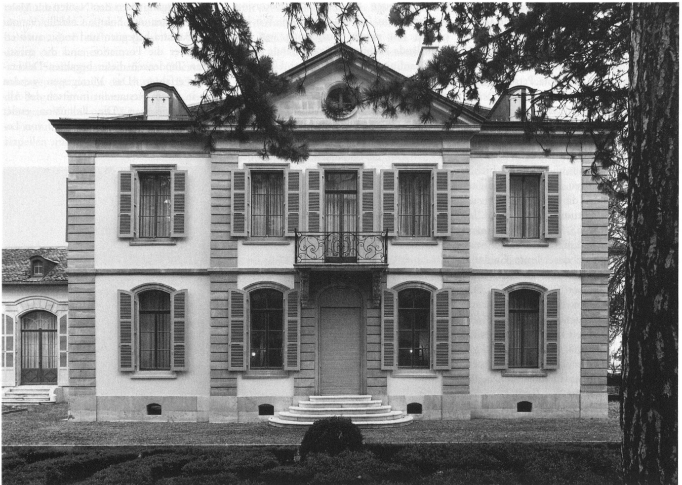
Genève, Institut et Musée Voltaire, façade sud.

Nous nous rendrons ensuite à Ferney (France), où Voltaire aménagea un très beau domaine qui touchait à celui de Tournay et transforma un modeste village en un bourg industriel. Il y édifia sur les plans du meilleur architecte de Genève un château moderne dont il dirigea les travaux lui-même. Dans cette demeure privée, nous visiterons le grand salon et la «chambre de Voltaire», où sont regroupés nombre de souvenirs de celui que l'on appelait le «Patriarche de Ferney». – Les participants doivent être munis d'un passeport ou d'une carte d'identité.