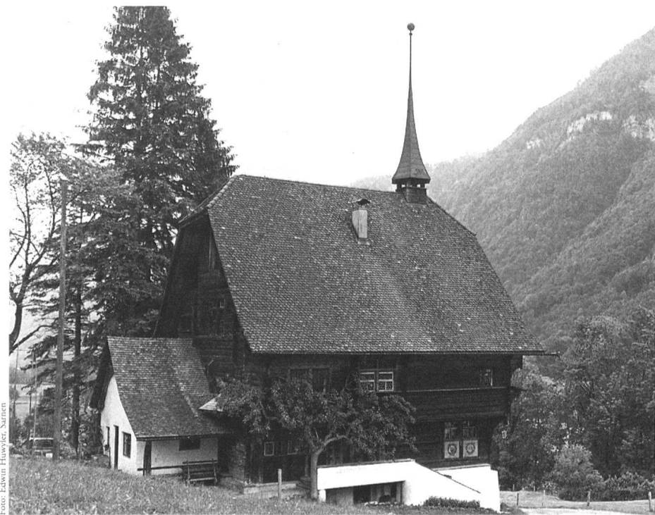
Wolfenschiessen, Hechbuis, 1586 erbaut für die vierte Gattin des bedeutenden Staatsmannes Melchior Lussy.

Ursprung und Ende der Welt heissen zwei Orte im Engelbergertal. Sie stehen für die Vielfalt einer in sich geschlossenen Kulturlandschaft, welche über Jahrhunderte hinweg durch das Benediktinerkloster Engelberg geprägt worden ist. Nach einer halbstündigen Carfahrt von Luzern nach Wolfenschiessen besichtigen wir hier das Hechbuis , einen steilgiebligen, reich ausgestatteten Blockbau aus dem ausgehenden 16. Jahrhundert, der zu den schönsten und besterhaltenen Holzhäusern der Schweiz zählt; er wurde für die vierte Gattin des bedeutenden Staatsmannes Melchior Lussy erbaut, der sich nach dem Vorbild Bruder Klaus' und Bruder Scheubers in die Einsamkeit zurückziehen wollte. Vorbei an dem aus dem 13. Jahrhundert stammenden Turm im «Dörfli» – Wohnturm für die Herren von Wolfenschiessen, die damals Amtsleute des Klosters Engelberg waren –, der Kapelle