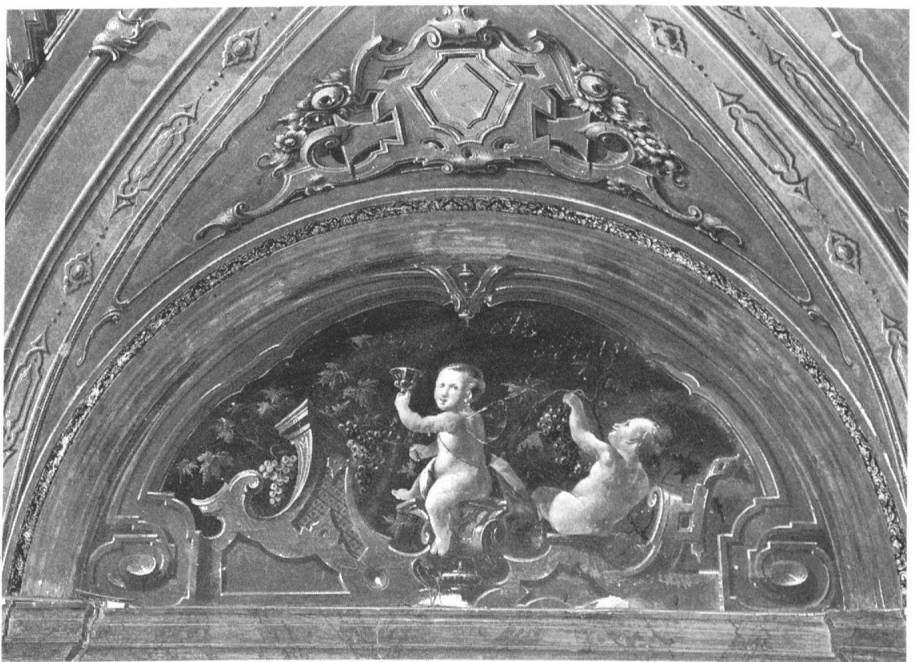
Locarno, der ehemalige Palazzo Morettini, heute Kantonsbibliothek.

Während wir uns mit anonymen Künstlern begnügen müssen, was Architektur und Stuck angeht, werden wir auf unserem Rundgang öfters den Namen der Maler Orelli (Vater und Sohn), Caldelli, Vanoni und Balestra begegnen und somit auch etwas über die Formation und die stilistischen Tendenzen dieser begabten Dekorateure erfahren. Das Mittagessen werden wir in einem Restaurant inmitten der Altstadt einnehmen. Die Exkursion endet um ca. 17.30 Uhr beim Bahnhof von Locarno.