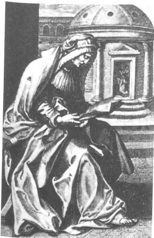
5 Crispijn de Passe der Ältere, Die Prophetin Hanna, Kupferstich. – Das Motiv der lesenden Alten geht auf calvinistische Emblemtraditionen der Niederlande zurück.

Der individuellen Bekehrung folgt die Bildung einer Gemeinschaft, die eine Gemeinschaft in Gott ist: «Das Einzelne, Besondere war vergessen, untergegangen in dem grossen Gefühle, Gemeinschaft zu haben mit dem Vater und dem Sohne durch den Geist, der lebendig in ihnen wohne ...» 20 . Der Pfarrer vergleicht das Bauernhaus und seine Familie mit der Kirche: «Als die Familie zum Volke geworden, hat man ein gemeinsames Haus gebaut, damit man nie vergesse in allgemeinen Zusammenkünften, dass man eigentlich nur eine Familie sei» 21 . Die Gemeinde steht stellvertretend für ein ganzes Volk, wie der einzelne sich nur als Glied der Familie definieren kann; und über den Begriff der «guten Familien» lässt Gotthelf keinen Zweifel; jedenfalls nicht «der städtische Pöbel ...» 22 . In der Stadt ist «das öffentliche Leben ... die Hauptsache», «Amt, Stellung, Staat», die vom Bürger, dem Gegenbild des Bauern, missbraucht werden «zur Sättigung seiner Lust oder seines Geldsäckels, während er von lauter System, Gemeinwohl und Volksinteresse überfließt» 23 . Hier spielt Gotthelf deutlich auf die Schlagworte des Radikalismus an, der für ihn Aus-