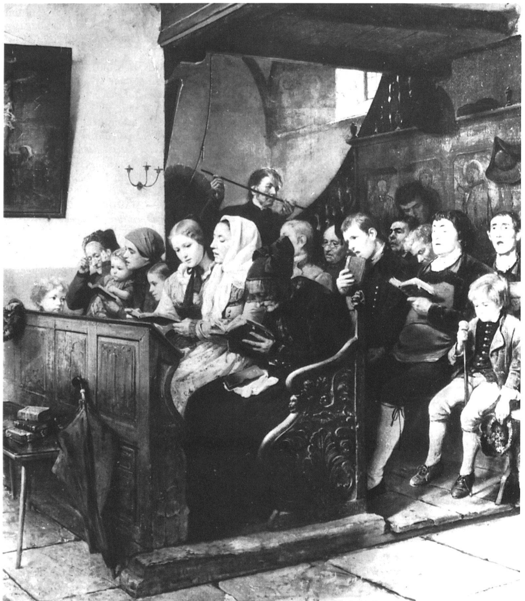
1 Marc Louis Benjamin Vautier, Andächtige in der Dorfkirche , 1858, Öl auf Leinwand, 85×73 cm. Stiftung Kunsthau Heylsbof, Worms.