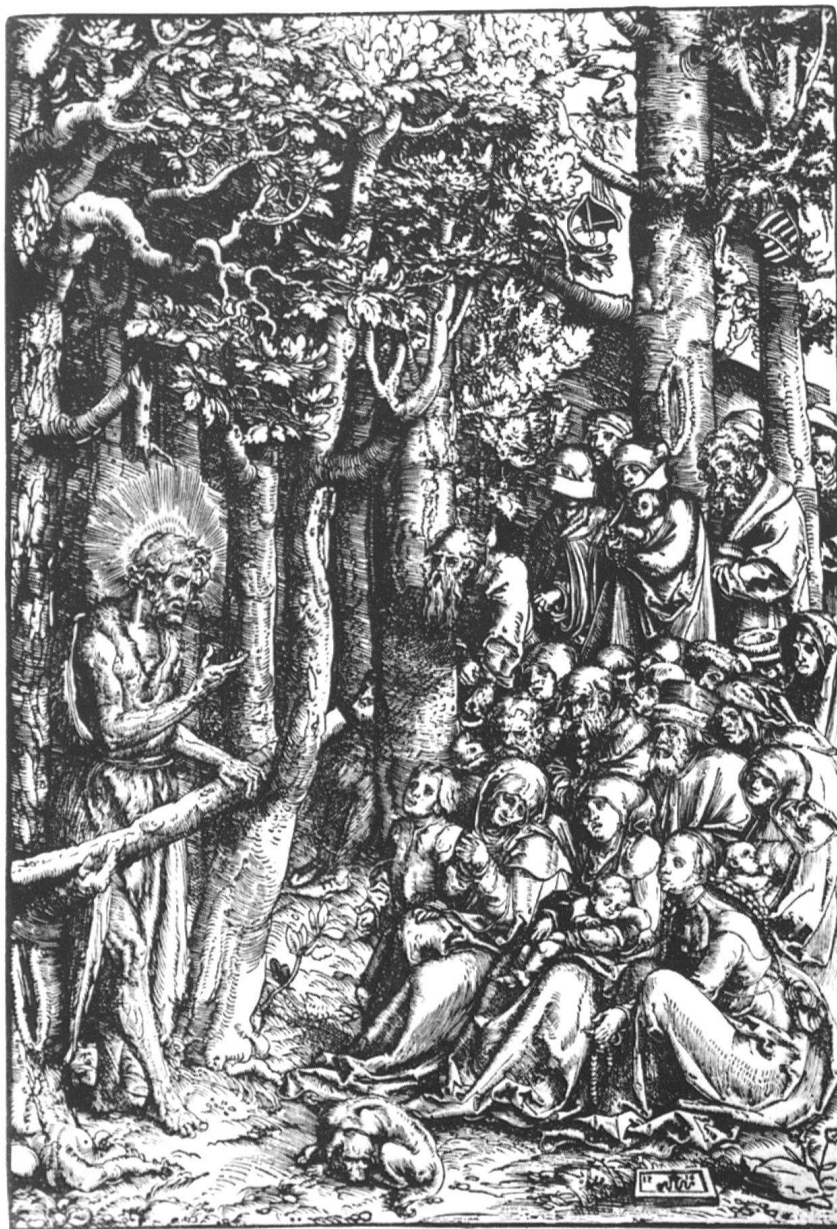
4 Lucas Cranach der Ältere, Predigt Johannes des Täufers , 1516, Holzschnitt, 33,5×23,6 cm. Kunsthalle Hamburg, Kupferstichkabinett. – Die Predigt ist ein fester Topos des protestantischen Bildgutes. Die gemischten, einfachen Volkstypen verkörpern das unmittelbare Verhältnis des Gläubigen zu Gottes Wort.

Staates verstand 9 . Für den Liberalismus war die Erziehung zum Glauben normativ und zugleich eine Erziehung zum Staatsbürger 10 . Theologische Spekulationen hingegen und Abspaltungen gewannen mithin eine politische Dimension und mussten unterbunden werden.