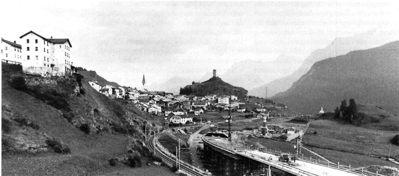
4 Ardez GR, nationales Pilotprojekt zum Europajahr für Denkmalpflege und Heimatschutz 1975. Südlich des Trases der Rhätischen Bahn ist die Umfahrungsstrasse im Bau, durch die das Untere Engadiner Bauerndorf vom Durchgangsverkehr befreit wurde.

Parallel mit dem Ausbau im nationalen Rahmen weitete sich das Arbeitsfeld der schweizerischen Denkmalpflege aber auch international. Die zusammen mit den Vereinigten Nationen gegründete UNESCO, die weltweite Dachorganisation für Erziehung, Wissenschaft und Kultur, förderte die Schaffung umfassender Organisationen all ihrer zahlreichen Tätigkeitsgebiete, wobei sie gelegentlich auch auf das Erbe des einstigen Völkerbundes aus der Zwischenkriegszeit zurückgreifen konnte. In der Denkmalpflege gab es kein eigentliches Vorbild. Im Mai 1957 fand so auf Betreiben der UNESCO in Paris der erste internationale Kongress der in der Denkmalpflege tätigen Architekten und Techniker statt. Gedacht war dabei in erster Linie an eine Zwischenbilanz nach der kulturellen Katastrophe des zweiten Weltkriegs, der mit der Vernichtung ganzer Städte in den kriegführenden Ländern durch Flächenbombardemente unvorstellbare Schäden und Verluste zur Folge hatte. Gefragt war somit einmal das Gespräch über die Grenzen hinweg; neben der Erörterung von Zielen und Wegen der Denkmalpflege wurden auch neue technische Möglichkeiten und Methoden erörtert. Programm und Teilnehmerkreis liessen zu Beginn schon erkennen, dass es um ein Gespräch unter Architekten und Ingenieuren ging; Archäologen und Kunsthistoriker sahen sich in eine Nebenrolle verwiesen. Dabei wollte man aber nicht stehenbleiben. Die Denkmalpfleger mindestens in Europa und