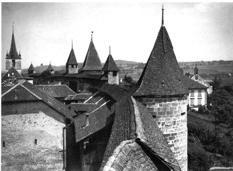
6 Murten FR, nationales Pilotprojekt zum Europäischen Denkmalschutzjahr 1975. Blick auf die wohlerhaltene mittelalterliche Wehrmauer; links aussen der Turm der reformierten Pfarrkirche.

Am 6. Mai 1963 wurde die Schweiz Mitglied des Europarates, der ältesten supranationalen politischen Organisation Europas und der einzigen, der wir bis heute angehören. In diesem Beitritt wird eine aussenpolitische Neuausrichtung fortgesetzt, die bereits ausgangs des zweiten Weltkriegs unter Bundesrat Max Petitpierre und seiner Devise Neutralité et Solidarité eingeleitet worden war. Im gleichen Jahr setzten auch die Bestrebungen des Europarats auf dem Gebiet der Denkmalpflege ein, gestützt auf eine Empfehlung (365), die von der parlamentarischen Versammlung gutgeheissen worden war. Dem Ministerkomitee wurde die Einleitung einer europaweiten Aktion zur Rettung des baulichen Erbes nahegelegt. Die wirtschaftliche Erholung Europas war seit dem Beginn der sechziger Jahre in