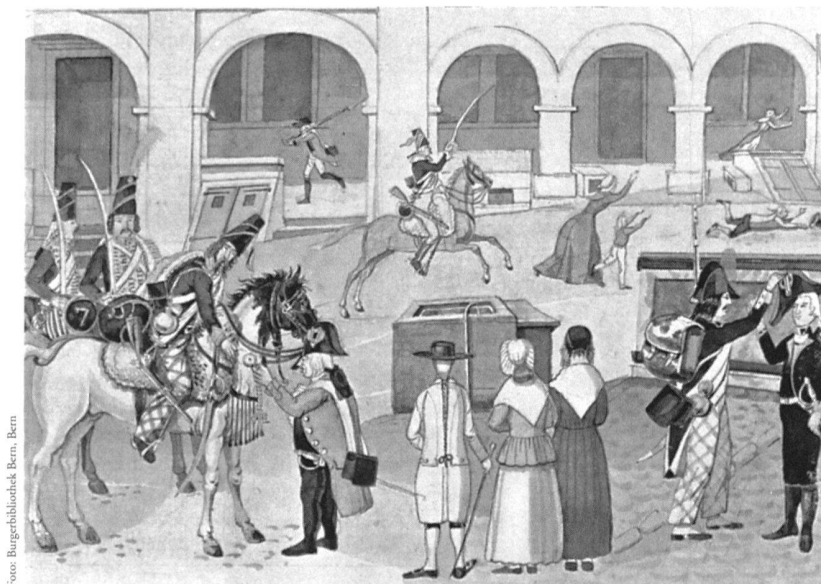
Karl Howald (1796–1869), Berner Brunnenchronik: Die Plünderungen nach dem Einfall der Franzosen am 5. März 1798

Im zweiten Teil wird ein Besuch im Restaurierungsatelier stattfinden, das die Burgerbibliothek gemeinsam mit ihrem Hausnachbarn, der Stadt- und Universitätsbibliothek Bern, besitzt und das eine der führenden Werkstätten auf diesem Gebiet darstellt. Dabei soll ein Einblick in die Methoden ermöglicht werden, mit denen man heute die gefährdeten Kulturgüter aus Pergament und Papier zu konservieren versucht, wobei man verantwortungsbewusst arbeitet und sich modernster Techniken bedient.