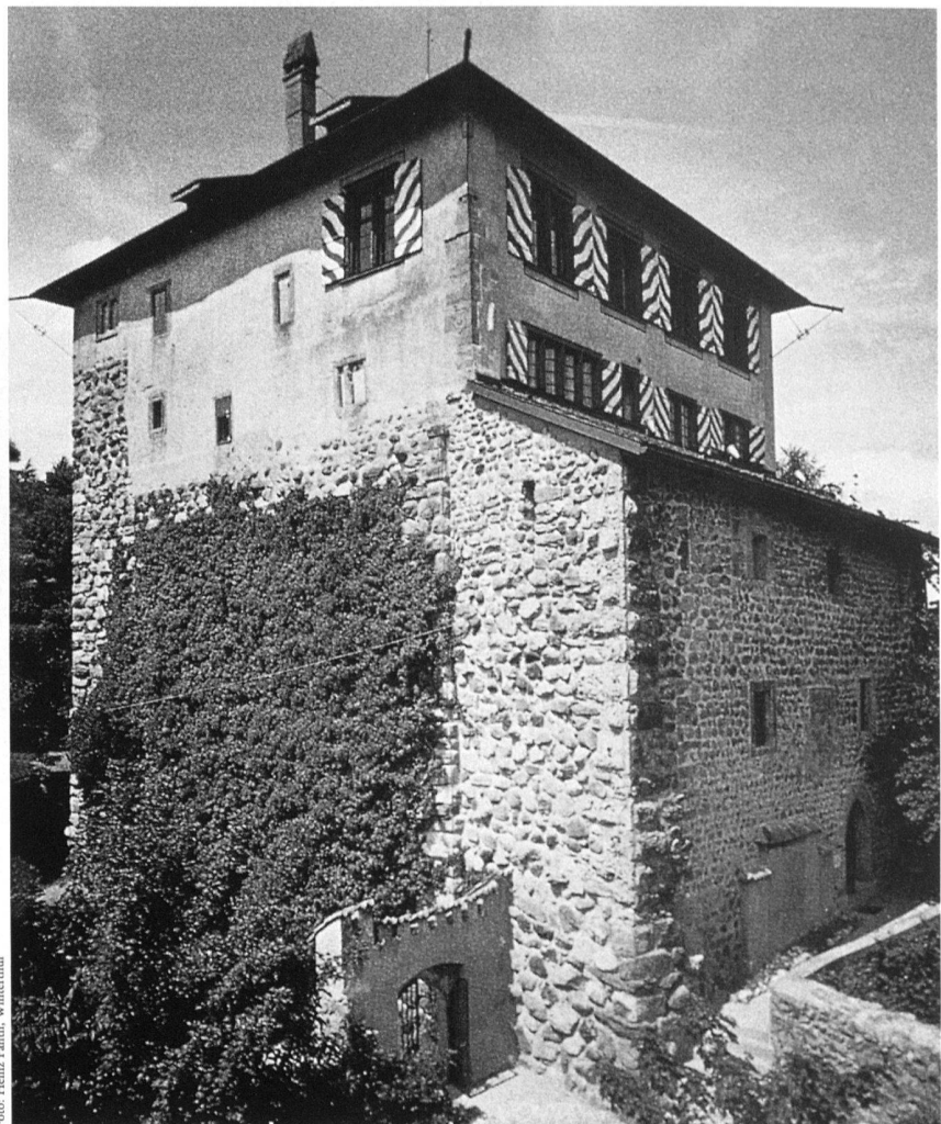
Winterthur-Stadel, Schloss Mörsburg, Wohnturm aus dem 12./13. Jahrhundert.

Die Führung findet ihren Abschluss im ehemaligen Wasserschloss Hegi am Ortsrand des gleichnamigen Dorfes. Im Zentrum der quadratischen Burganlage erhebt sich ein mächtiger Wohnturm aus der Zeit der ersten Hälfte des 12. Jahrhunderts. Um 1500 liess Bischof Hugo von Konstanz einen neuen Wohntrakt in Fachwerkbauweise errichten. Die Burg diente damals wohl als Sommerfrische für den Bischof. – Für den etwa zwanzigminütigen Spaziergang zur Burgruine Alt-Wülflingen wird gutes Schuhwerk empfohlen.