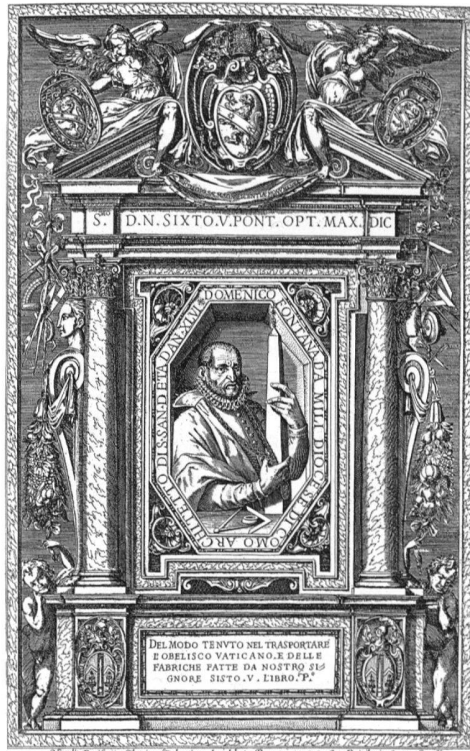
1 Domenico Fontana, frontispice du livre «Della Trasportatione dell'obelisco vaticano e delle fabbriche di nostro Signore Papa Sisto V (...)», Libro primo, Roma: D. Basa, 1590, gravé en 1589. – En ouverture de son livre, D. Fontana synthétise admirablement l'art multiforme du bâtisseur-architecte de la région des Lacs.

L'hypothèse de la compétence constructive entraîne avec elle le problème des origines de cette culture régionale particulière. Elle nous resitue dans la nécessité d'entreprendre une critique des expériences artistiques et architecturales qui, entre le VII e et le XV e siècle, sous les noms de Maestri Comacini d'abord, et de Maestri Campionesi par la suite, ont formé les premières identifications historiographiques et, en même temps, l'origine presque mythi-