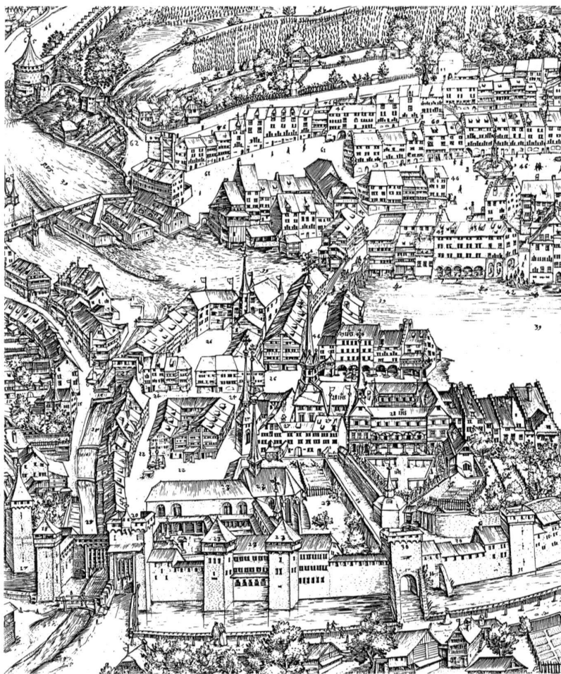
Martinus Martini, Ansicht der Stadt Luzern, 1596/97, Ausschnitt mit Franziskanerkirche und Bauten des Jesuitenordens.

Neben dem Auftraggeber interessierte aber auch die Person des Künstlers. Aus zeitgenössischen Dokumenten ist bekannt, dass für die Herstellung der Planveduten des 16. und frühen 17. Jahrhunderts ausführliche Vermessungen des Strassennetzes vorgenommen und zahlreiche Skizzen von Häuserfassaden angefertigt wurden. Obwohl die Vorarbeiten mehrere Monate, manchmal sogar Jahre dauerten, wurden die meisten Planveduten vermutlich von einem einzelnen Künstler (im Alleingang) hergestellt, der also neben handwerklichen und künstlerischen auch technische Fähigkeiten für die Vermessung der Stadt besitzen musste. Interessant sind die Lebenswege von Gregorius Sickingen und Martinus Martini. Beide zogen von Stadt zu Stadt, um ihre Dienste als Hersteller von Planveduten anzubieten. In Bern traten sie um 1600 als Konkurrenten auf, wobei der (vermutlich) «billigere» Sickingen schliesslich