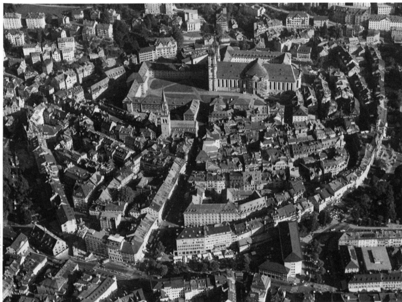
Flugaufnahme von St. Gallen mit Altstadt und Stift.