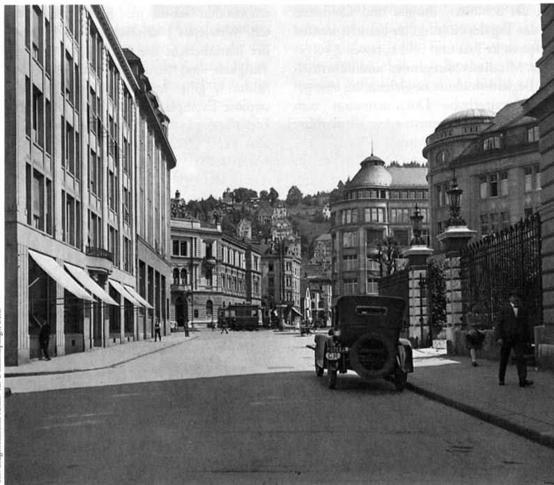
St. Gallen, Kornhausstrasse und frühere Helvetiakreuzung. Der Welthandel formulierte sich im bahnhofnahen Handelsquartier, wo repräsentative Geschäftsbauten der Architekten Johann Christoph Kunkler, Curjel & Moser und Pflögardt & Haefeli entstanden. Fotografie um 1910.

Der in eine voralpine Umgebung eingebettete Obwaldner Hauptort erlebte zwischen 1850 und 1920 eine langsame, aber stetige Bevölkerungs- und Siedlungsentwicklung. Durch den Bau von Brünigstrasse (1857–1860) und Brünigbahn (1886–1888) wurde der ländliche Flecken ans Verkehrsnetz des Schweizer Mittellandes angeschlossen. Der aufblühende Tourismus förderte die Entstehung zahlreicher Gaststätten und führte zur Verbesserung der technischen Infrastruktur. So waren die Umleitung der Melchaa in den Sarnersee (1878–1880) und die Sarneraa (1881–1882) für die überschwemmungsgefährdete Siedlung von grosser Bedeutung. Zwei Industrieprodukte, Parkett und Strohhut, erlangten eine wichtige wirtschaftliche Funktion. Die Strohhutfabrik wuchs zum zeitweilig grössten Arbeitgeber im Kanton. Zwischen Dorf und See entstand mit den verschiedenen Kollegiumsbauten ein eigentlicher Bildungsbezirk von weitreichender Ausstrahlung. Nach 1900 setzten öffentliche Bauten neue Akzente. Trotz grosszügiger Planungsansätze um 1910 verlief die Bautätigkeit im und ausserhalb des historischen Siedlungsgebietes über die INSA -Periode hinaus eher gemächlich.