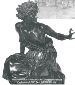
Gesellschaft für Schweizerische Kunstgeschichte GSK, Eszylstrasse 2, 3001 Bern, Tel. 031/ 901 42 81