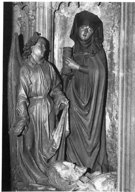
3 Vieux-Thann, Eglise Saint-Dominique, saint sépulcre. Sainte Marie-Madeleine identifiable à ses longs cheveux dénoués. Cette statue médiane est cachée par le pilier central. La chevelure abondante, le visage rond, l'élégance du geste renvoient au milieu strasbourgeois.