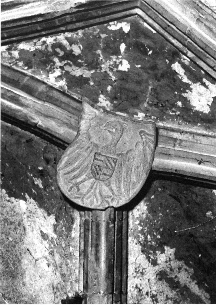
8 Vieux-Thann, Église Saint-Dominique, saint sépulcre. – Armoiries de Maximilien I er sur la voûte du saint sépulcre: l'aigle monocéphale peut être identifiée (en l'absence de polychromie), soit comme l'aigle du comté du Tyrol dont Maximilien devient détenteur en avril 1490, soit comme celle du royaume de Germanie, dont Maximilien est roi entre 1486 et 1493. Le blason en abîme est écartelé aux armes d'Autriche et de Bourgogne.

gogne. La présence bourguignonne est visible à Thann depuis le début du XV e siècle 15 , elle se manifeste notamment dans le chœur de la collégiale Saint-Thiébaud.