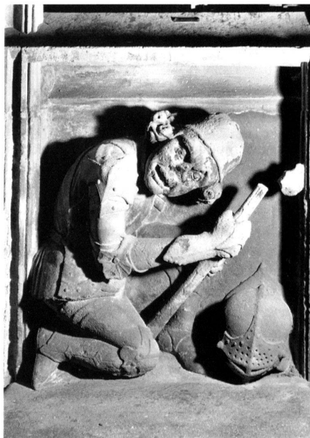
6 Vieux-Thann, Eglise Saint-Dominique, saint sépulcre. – Panneau droit de face: soldat vu de dos, son armure et son casque sont caractéristiques des années 1480 (cf. note 12). On admirera la manière dont le sculpteur a rempli le champs à sa disposition. Le soldat tourne le dos au spectateur pour pouvoir regarder le Christ.