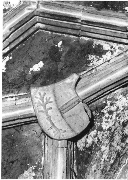
7 Vieux-Thann, Eglise Saint-Dominique, saint sépulcre. – Armoiries de la ville de Thann, accordées sous cette forme en 1469, visibles sur la voûte.

Les statues debout 11 sont caractérisées par la rondeur des visages, la chevelure souple, le léger hanchement ainsi que les drapés un peu raides et sobres. L'attitude de l'ange retenant sa tunique peut dériver de L. 67 de Martin Schongauer. Ces sculptures de très grande qualité n'ont guère d'équivalent stylistique en Haute-Alsace, par contre elles présentent des