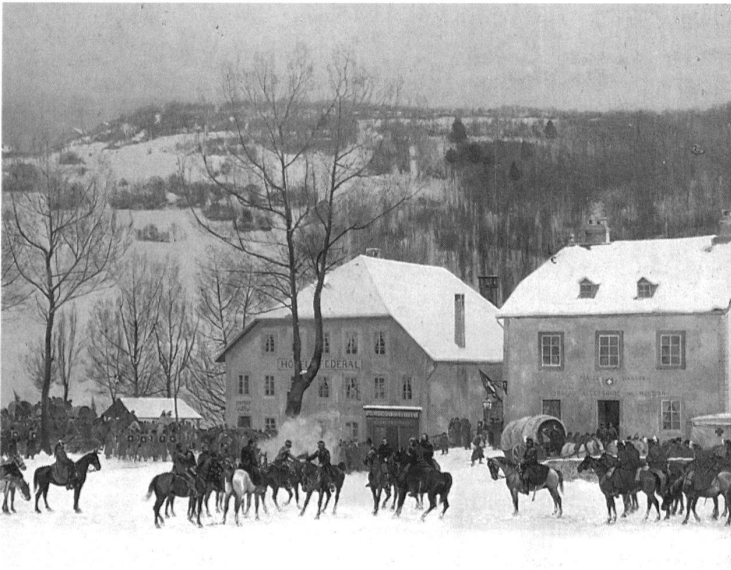
Luzern, Bourbaki-Panorama, 1881, Ausschnitt mit der Begrüssungsszene zwischen dem französischen Generalstab und dem schweizerischen Generalstab vor dem Hotel Fédéral und dem schweizerischen Zollhaus, eine Schlüsselszene in Castres Panoramabild.

junge Ferdinand Hodler. Die Gestaltung des Faux-terrains übernahm der Genfer Bühnenbildner Henry Silvestre. Die Übertragung der Vorzeichnung auf die gewölbte Leinwand gestaltete sich nicht ohne Schwierigkeiten. Als erstes wurde die Hilfskonstruktion in Form der Quadratur auf den Malgrund übertragen, sodann die auf der runden Leinwand aufgetretenen perspektivischen Verzerrungen auskorrigiert. Die Arbeit an der Leinwand selbst erfolgte von einem Gerüst aus innerhalb weniger Monate. Die Aufsicht und Organisation lagen vollständig in den Händen von Edouard Castres. Für künstlerische Individualitäten und eigene Freiheiten der beteiligten Malerkollegen blieb daher kaum Spielraum. Einzig die markante und gestaltende Handschrift des jungen Ferdinand Hodlers ist heute in der Szene des Berner Bataillons noch deutlich erkennbar.