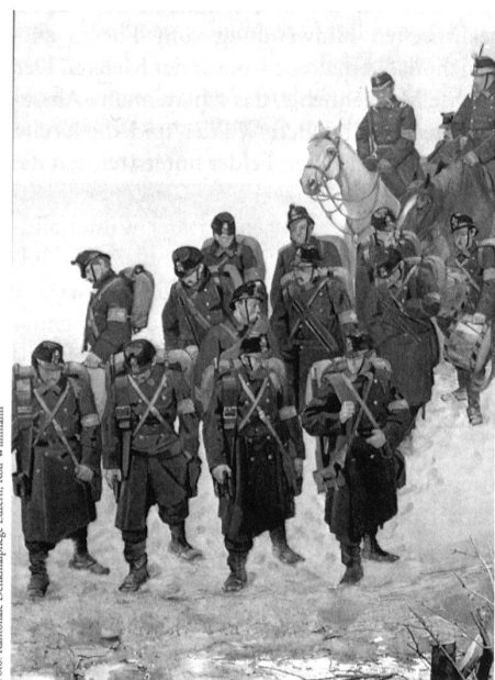
Luzern, Bourbaki-Panorama, 1881, Ausschnitt mit dem Berner Bataillon, das in Les Verrières eintrifft. In der vordersten Reihe als zweiter von rechts hat sich der Künstler Ferdinand Hodler, der an der Ausführung des Gemäldes mitbeteiligt war, selbst dargestellt.