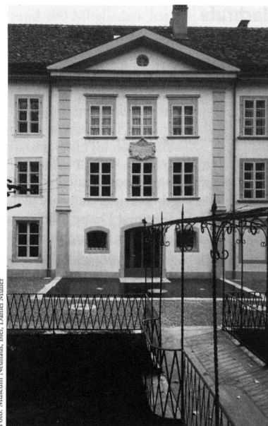
Das 1995 neueröffnete Museum Neuhaus in Biel, Hauptgebäude, Eingangspartie.

Der Umbau und die Sanierung der Gebäudegruppe an der Schüsspromenade 24–28 und der Seevorstadt 52–56 konnten