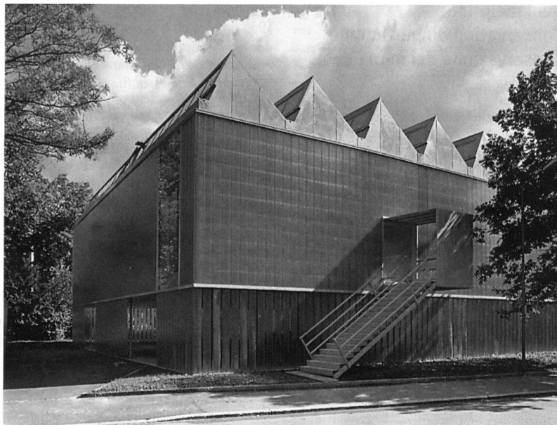
Erweiterungsbau des Kunstmuseums Winterthur der Zürcher Architekten Annette Gigon und Mike Guyer, 1995.

Von 1960 bis 1990 hat sich der Sammlungsbestand des Kunstvereins Winterthur mehr als verdoppelt – von knapp 800 auf über 1600 Werke –, was zur Folge hatte, dass die beiden Hauptaufgaben des Museums, die Sammlungspräsentation und die Ausstellungstätigkeit, in den zur Verfügung stehenden Räumen nicht mehr gleichzeitig wahrgenommen werden konnten. Während in den siebziger und achtziger Jahren in zahlreichen Schweizer Städten Museen umgebaut oder erweitert wurden, tat sich in