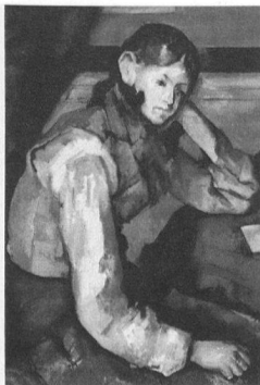
Emil Maurer Stiftung Sammlung E.G. Bührle, Zürich