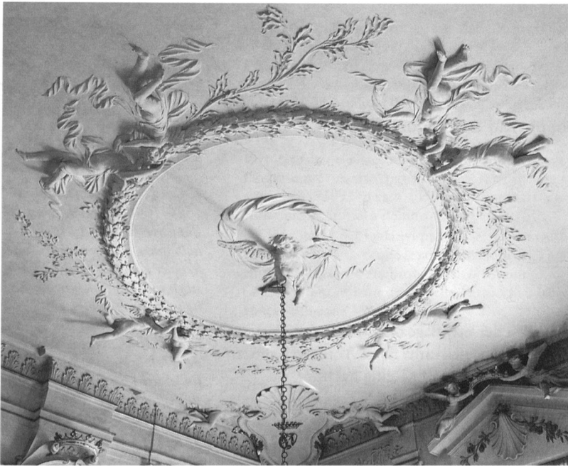
5 Schloss Poya. Stuckdecke des grossen Salons, um 1700.