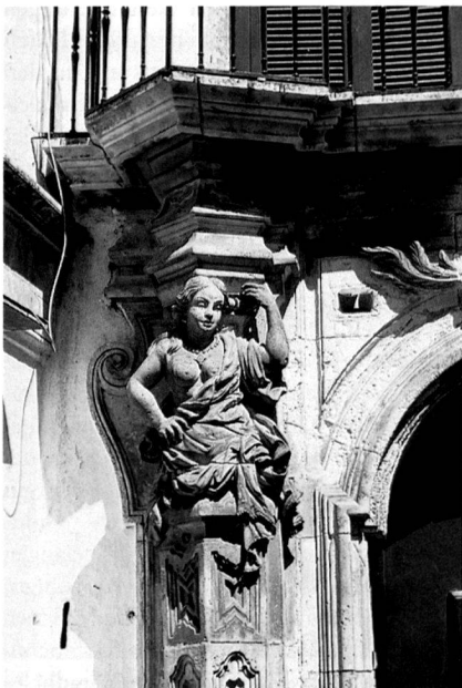
Martina Franca, Palazzo Ancona

Brindisi (Stadt, Ende der Via Appia, Brindisi sotteranea), Lecce (Stadtbild, Kirchen,