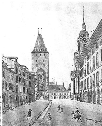
Jakob Samuel Weibel, Porte de St. Christophe à Berne, 1795, Aquarelle colorée, 30,5×24,2 cm, Collection privée.