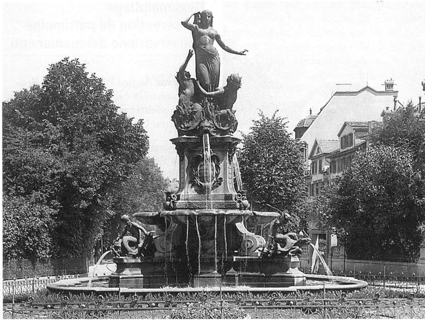
Der Broderbrunnen von August Bösch um 1910/20.