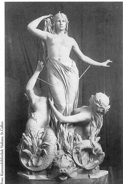
Tonmodell der Hauptgruppe des Broderbrunnens. Die mittlere Nymphe erinnert an Arnold Böcklins «Venus Anadyomene» von 1872.

Am 20. 2. 1999 findet eine Führung durch die Kunstgiesserei Lehner in St. Gallen statt, wo der Broderbrunnen gegenwärtig restauriert wird. Siehe beiliegendes Veranstaltungsprogramm «Kunst+Quer», Veranstaltung Nr. 7.