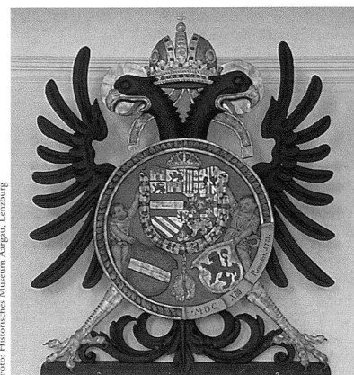
Les armoiries en relief de l'empereur Matthieu, réalisées en 1614 dans l'atelier des deux sculpteurs Heinrich et Melchior Fischer à Laufenbourg. – Au tribunal de Laufenbourg, la juridiction (suisse) est encore exercée de nos jours sous ces armoiries et les portraits de l'archiduchesse Marie-Thérèse et de l'empereur Joseph II. La demi-aigle des armoiries du canton de Genève perpétue le souvenir de l'immédiateté impériale dont bénéficiait Genève.

Placée sous le haut patronage de S.A.I.R. l'Archiduc Otto de Habsbourg, l'exposition qui aura lieu au Muséum d'histoire naturelle à Genève bénéficie notamment