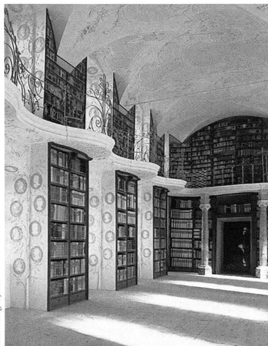
Stiftsbibliothek Einsiedeln, Barocksaal nach der Restaurierung, Blick gegen Nordosten. – In den Fensternischen Medaillons mit Kaiserporträts.