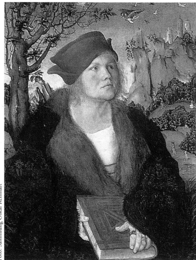
Lukas Cranach der Ältere, Bildnis von Johannes Cuspinian, 1502, Sammlung Oskar Reinhart «Am Römerholz».