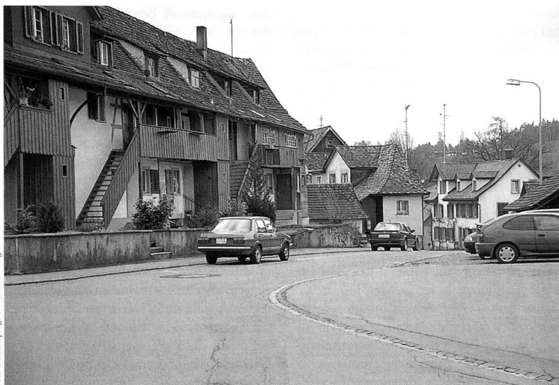
Hauptwil, «Langbau», dendrochronologisch um 1670 datiert. – Die Häusergruppe «Langbau», «Kurzbau» und «Gelbbau» ist das früheste Schweizer Beispiel für Arbeiterwohnungsbau in der Textilindustrie.

Schon im 15. Jahrhundert legte das Bischofszeller Pelagistift an der Stelle einiger Tümpel oberhalb des heutigen Dorfes Hauptwil fünf Fischweier an. Da das Wasser dadurch regulierbar wurde, siedelte sich