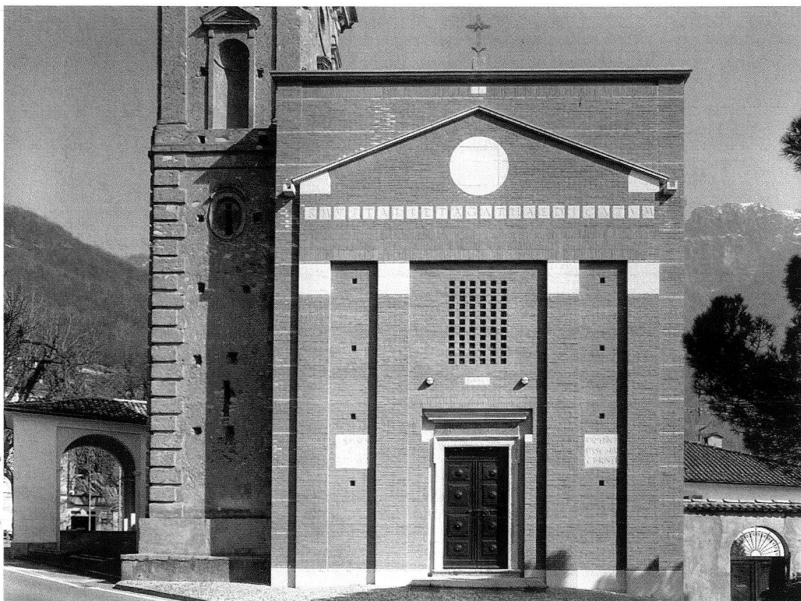
Saint-Vitale et Sainte-Agathe, vue de la façade.

L'architecture structure la perception, le parcours que fait le regard se portant alternativement sur la surface de pierre du campanile, puis sur les surfaces crépies de l'église et ensuite sur la surface de brique de la façade. Le regard saisit l'évolution historique. Nous en comprenons les strates. Notre perception a changé. L'église se lit comme un monument actualisé, inscrit dans la continuité de notre temps. L'intervention de Tita Carloni s'ajoute à une architecture existante, dont il a repris des éléments dans une préciosité chromatique particulièrement réussie. La couleur de la brique rappelle la couleur du camaïeu d'origine. Les fresques en tant que telles ont disparu, mais leur dessin/dessin réinterprété est réintroduit sous forme de plaques blanches, aux épigraphes en lettres dorées, comme d'autres éléments