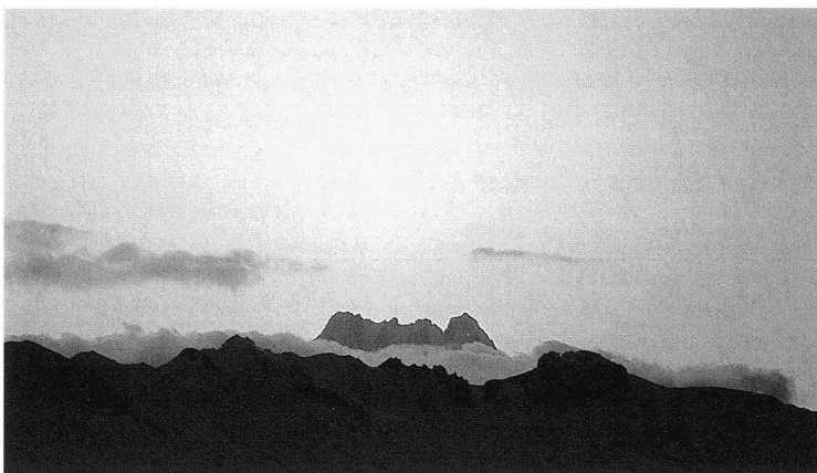
14.10.92 – 17.35 Uhr