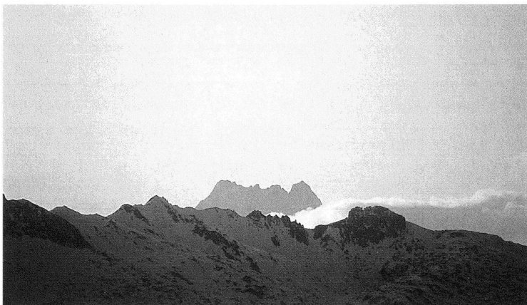
14.10.92 – 17.00 Uhr