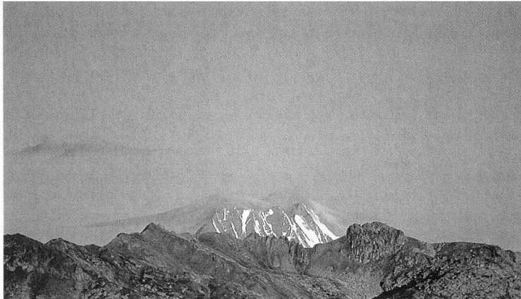
19.08.90 – 07.00 Uhr