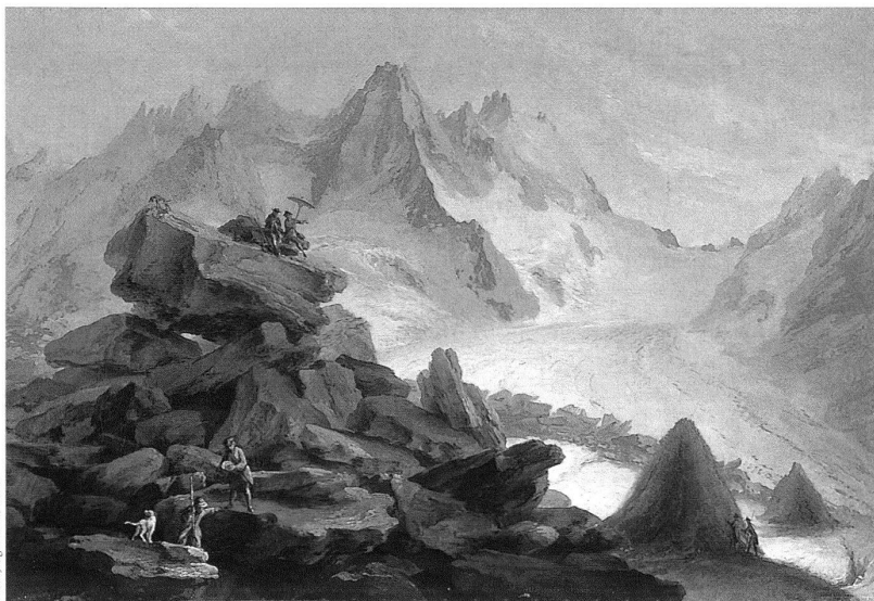
Caspar Wolf, Der Lauteraargletscher mit Blick auf den Lauteraarsattel , 1776, Öl auf Leinwand, 54 × 82 cm, Aargauer Kunsthaus Aarau.

Von den neueren Ausstellungen hat Viaggio verso le alpi als Auftakt der Reihe wohl auch das grösste Medienecho hervorgerufen. Dreisprachig angelegt und mit grosszügiger Nutzung der Seiten, kann man meist bekannte Bergbilder aus Schweizer Sammlungen betrachten, mit geringer Vertiefung in literarisch oder essayistisch angelegten Texten. In einem motivisch-ikonographischen Parcours werden die Erscheinungsweisen der Berge in der Schweizer Malerei von Caspar Wolf bis in die frühe