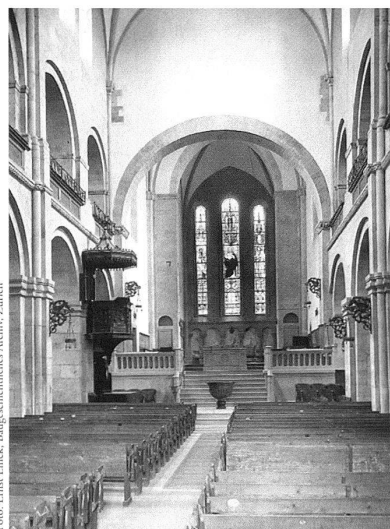
Zürich, Grossmünster, Inneres gegen Osten.

In einer ausführlichen Einleitung macht Meier die Leser mit ausgewählten, für das Verständnis der Romanik in unserem Gebiet wichtigen Aspekten bekannt. An den Anfang stellt er die Charakterisierung der einzelnen Landesteile und ihrer (kirchen-)politischen Herrschaftsverhältnisse und Abhängigkeiten, die sich auf die Kunstproduktion auswirkten. Anschaulich wird dabei aufgezeigt, dass nicht nur regionale Besonderheiten die Sakralkunst prägten, sondern dass aufgrund spezieller historischer Konstellationen und Wechselbeziehungen auch interessante Mischformen entstanden. Zugehörigkeit zu einem Bistum oder Orden, konkurrierende Auftraggeber, aber auch wichtige Transitwege zwischen einzelnen Regionen sind Faktoren, welche die Grenzen starrer Kunstlandschaften auflösen und überregionale Zusammenhänge schaffen.