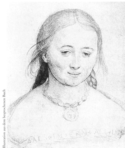
Illustration aus dem besprochenen Buch

Hans Holbein d.J., Porträt einer lächelnden jungen Frau , um 1520/22, Silberstift, Pinsel, Rötel und Weissböhungen auf rosa grundiertem Papier, 19,6×15,4 cm, Paris, Louvre, Cabinet des Dessins .