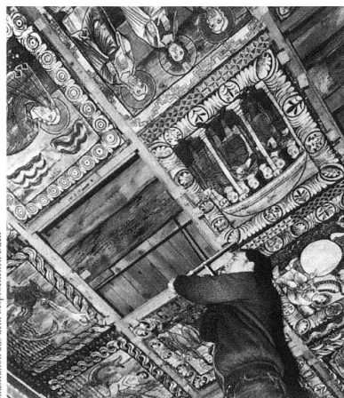
Illustration aus dem besprochenen Buch