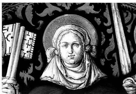
6, 7, 8 Dettagli del rosone nella parete absidale: il viso di Cristo sul sudario della Veronica, santa Veronica e il leone, simbolo dell'evangelista Marco.