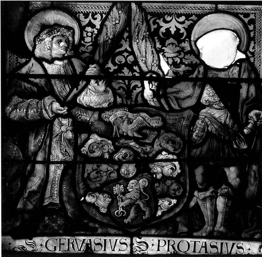
11 Crevoladossola, chiesa pievana dei SS. Pietro e Paolo, i santi Gervasio e Protasio con gli stemmi dei Della Silva. La testa di san Protasio è andata perduta.

in prospettiva. Non soltanto le figure, ma pure i leoni, per esempio, sono estremamente vicini ai felini araldici delle vetrate di Funk. In tale contesto, per quanto attiene agli sfondi bianchi dei trafori di Crevoladossola le cose stanno diversamente. Per il ciclo di vetrate losannesi Funk utilizzò fondi senza decorazioni dipinte, rarissimi nell'arte vetraria svizzera del periodo; l'uso di fondi chiari portò ad una lotta fatale con un collega di lavoro invidioso, che sfociò in un omicidio e nella fuga di Funk da Berna, poco prima della sua morte avvenuta nel 1539. Anche in due vetrate di Losanna mancano le strutture architettoniche. Strette analogie con le vetrate di Crevoladossola erano riscontrabili in frammenti di vetrate andate distrutte pressoché completamente nell'incendio che devastò la chiesa di Hindelbank nel 1911. 5 Esse appartenevano al ristretto gruppo di opere non firmate ricollegabili stilisticamente ad Hans Funk. Tra i diversi motivi decorativi vi era pure quello delle «nuvole a meandro». La somiglianza con le vetrate nella chiesa di Ligerz, pure appartenenti al gruppo citato, era già stata individuata da Gian Franco Bianchetti. Questa serie di confronti mostra che le vetrate di Crevoladossola sono ancora più raffinate, più ricche di sfumature e