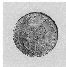
8 Guinea von Wilhelm III. und Maria von England, 1689. Mst. 1:1 (vgl. Abb. 2).