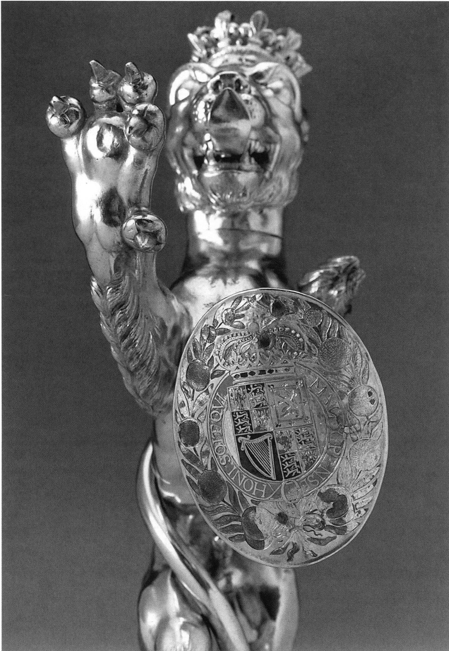
6 Trinkgefäss in der Form eines Leoparden (Ausschnitt, vgl. Abb. 1). – Der Schild, den die Raubkatze in der linken Pranke hält, zeigt das in Emailfarben ausgeführte gekrönte englische Königswappen, umgeben vom Knieband des Hosenbandordens sowie von belaubten Zweigen mit Orangen.

Berner Goldschmied Emanuel Jenner in Auftrag. Wohl im Spätsommer konnte das kostbare Gefäss der Gesellschaft übergeben werden. 24 Welchen Eindruck das Geschenk auf die jungen Berner Aristokraten machte, ist leider nicht überliefert. Erst im Jahre 1791 wurde der Leopard in einem Inventar der Gesellschaft erwähnt. 25 In den darauf folgenden Jahren erlebte das Trinkgefäss eine veränderliche Geschichte mit einer Reihe von Besitzerwechseln. Nach dem Einmarsch der Franzosen im Jahre 1798 löste sich der «Äussere Stand» auf. Sein Silberbestand wurde 1801 zur Tilgung seiner Schulden durch die Gemeinde-