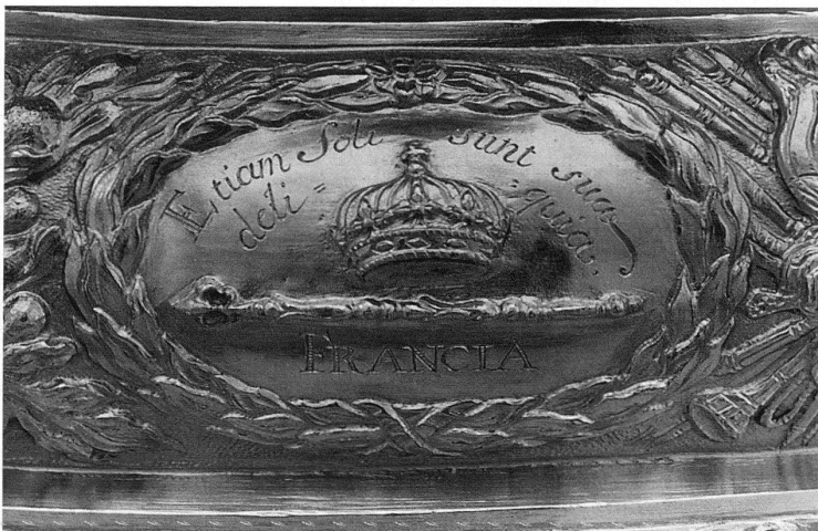
5 Trinkgefäss in der Form eines Leoparden (Ausschnitt, vgl. Abb. 1). – Medaillon am Sockel mit der französischen Krone und dem allegorischen Spruch ETIAM SOLI SUNT SUAE DELIQUA (auch die Sonne hat ihre Mängel) als Anspielung auf den Sonnenkönig Ludwig XIV. von Frankreich.

Um auch Bern für das geplante Soldbündnis zu gewinnen, reiste Coxe im Sommer 1690 selbst in die Aarestadt. Am 26. Juli zog er mit seiner Familie feierlich in Bern ein. Die Berner bereiteten ihm ebenfalls mit Kanonendonner einen würdigen Empfang. Bereits am 28. Mai 1690, dem Geburtstag König Wilhelms III., hatten hier Angehörige des «Äusseren Standes» zu Ehren des Königs ein Manöver abgehalten. Der «Äussere Stand» war nach der Statutenrevision von 1688 eine Art Schattenregierung der jungen Berner Patrizier, die sich in der Kunst der hohen Politik übten. Einige dieser Jünglinge hegten wohl Hoffnungen, vom künftigen Soldbündnis mit England profitieren zu können und in der Armee Wilhelms eine Offiziersstelle zu ergattern. 23 In einem Brief informierte Coxe den König über die ihm zuteil gewordenen Ehren. Als Dank und wohl auch, um den Abschluss des Soldvertrags zu fördern, schenkte Wilhelm dem «Äusseren Stand» ein Trinkgefäss in der Form eines Leoparden. Coxe gab den Becher beim