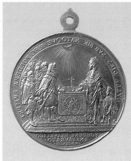
4 Medaille auf das Bündnis des französischen Königs Ludwig XIV. mit den Eidgenossen 1663, Gold, ohne Öse 55,6 mm, 112,74 g, Bernisches Historisches Museum, Inv. 88.666, Geschenk A. v. Ernst, Mst. 1:1. – Vorderseite: Büste des jungen Ludwig XIV. Rückseite: Beschwörung des Bündnisses in der Kathedrale Notre-Dame in Paris, welche in Medaillen, Gemälden und Gobelins verewigt wurde. Die eidgenössischen Gesandten erhielten als Erinnerungstück je eine goldene Medaille.