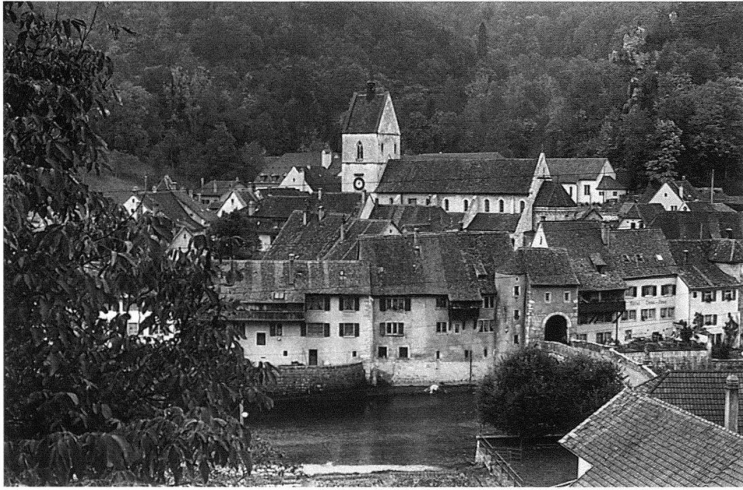
2. St. Ursanne (JU): Mit dem Talererlös 1979 wurde die Stiftung Pro St-Ursanne gegründet. Sie leistet bis heute gezielt Beiträge an Restaurierungsarbeiten Privater in der Alistadt. Aufnahme 1979.

lverpackung nur mit Alufolie herstellen. Immerhin wird heute wesentlich dünnere Alufolie verwendet. Die goldene Hülle macht die Schokoladerondelle erst zum Taler und damit zu diesem unverwechselbaren Symbol. Der beliebte Inhalt stellt beim Kauf einen willkommenen Gegenwert dar. Er führt dazu, dass man den Taler auch weiterschenken kann, was man mit einem Abzeichen kaum tut.